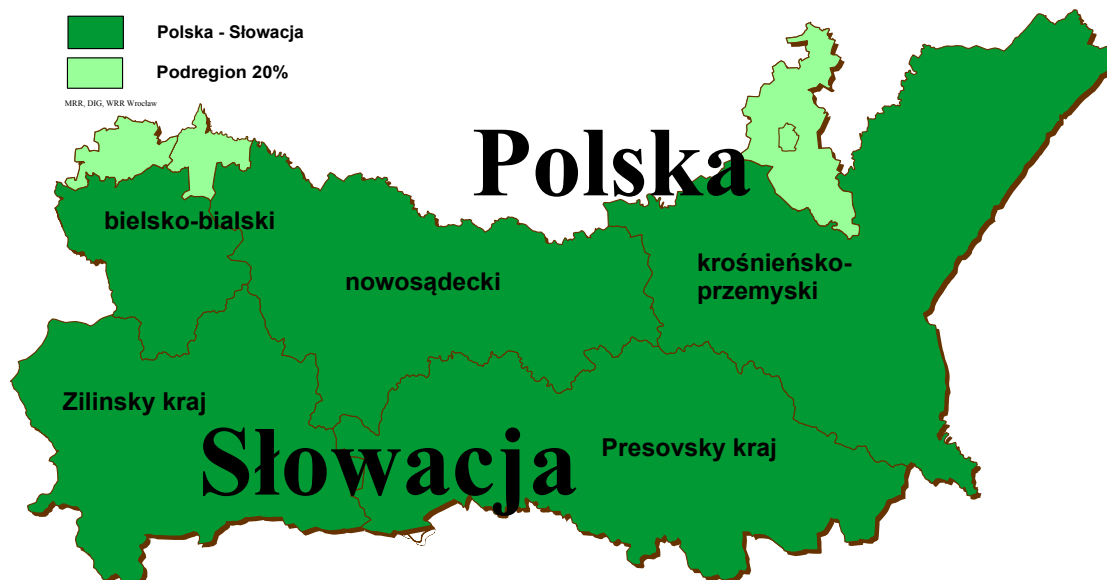
Mapa nr 1 – obszar wsparcia Programu

W powiatach: pszczyńskim, oświęcimskim, rzeszowskim oraz w powiecie grodzkim Rzeszów, projekty będą realizowane zgodnie z art. 21 Rozporządzenia (WE) nr 1080/2006 Parlamentu Europejskiego i Rady z dnia 5 lipca 2006 r. w sprawie Europejskiego Funduszu Rozwoju Regionalnego i uchylającego rozporządzenie (WE) nr 1783/1999 (zwanego dalej Rozporządzeniem (WE) nr 1080/2006) dopuszczającym, w odpowiednio uzasadnionych przypadkach oraz pod warunkiem uzyskania akceptacji PKM Programu, możliwość finansowania wydatków przez partnerów mających siedzibę na obszarach przyległych do zasadniczego obszaru Programu w wysokości do 20% alokowanych na FM środków EFRR. Zasada elastyczności obowiązuje na poziomie całego Programu i będzie monitorowana na poziomie całej alokacji EFRR w ramach wszystkich priorytetów.