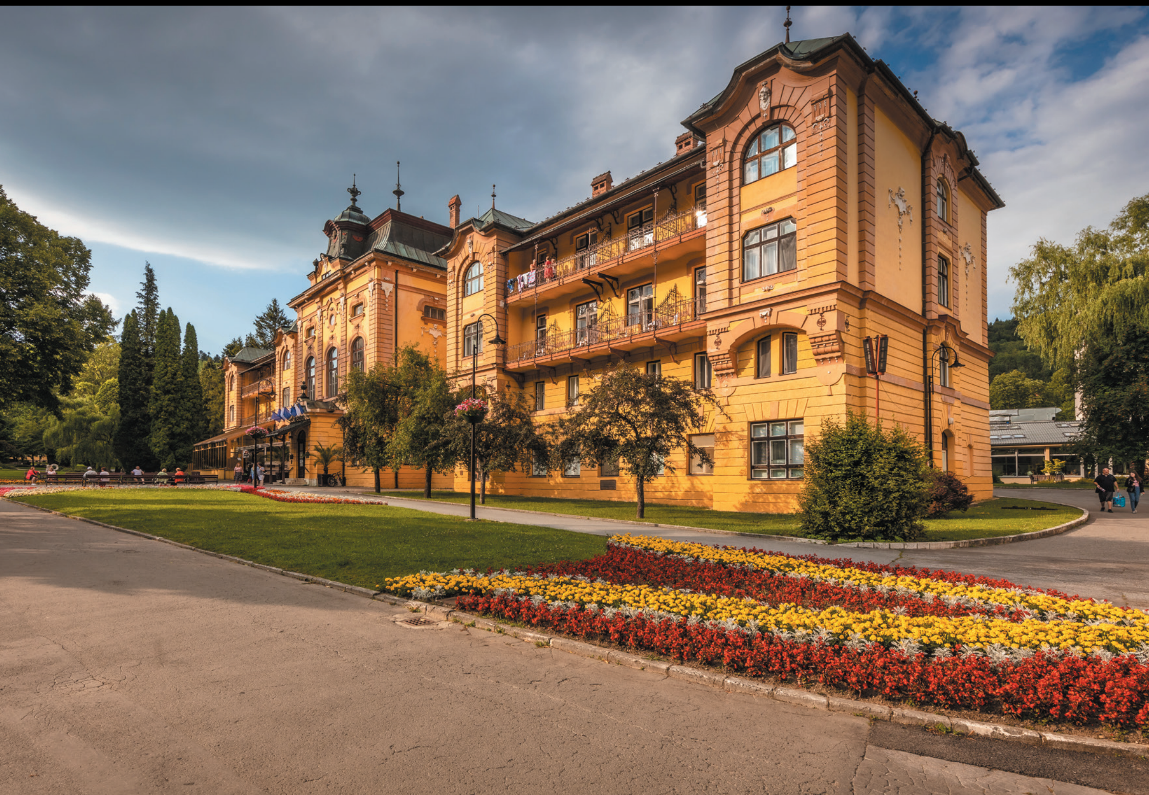
Uzdrowisko Bardejowskie Kupele – Hotel Astória Bardejovské Kúpele – Hotel Astória Spa Bardejov – Hotel Astória