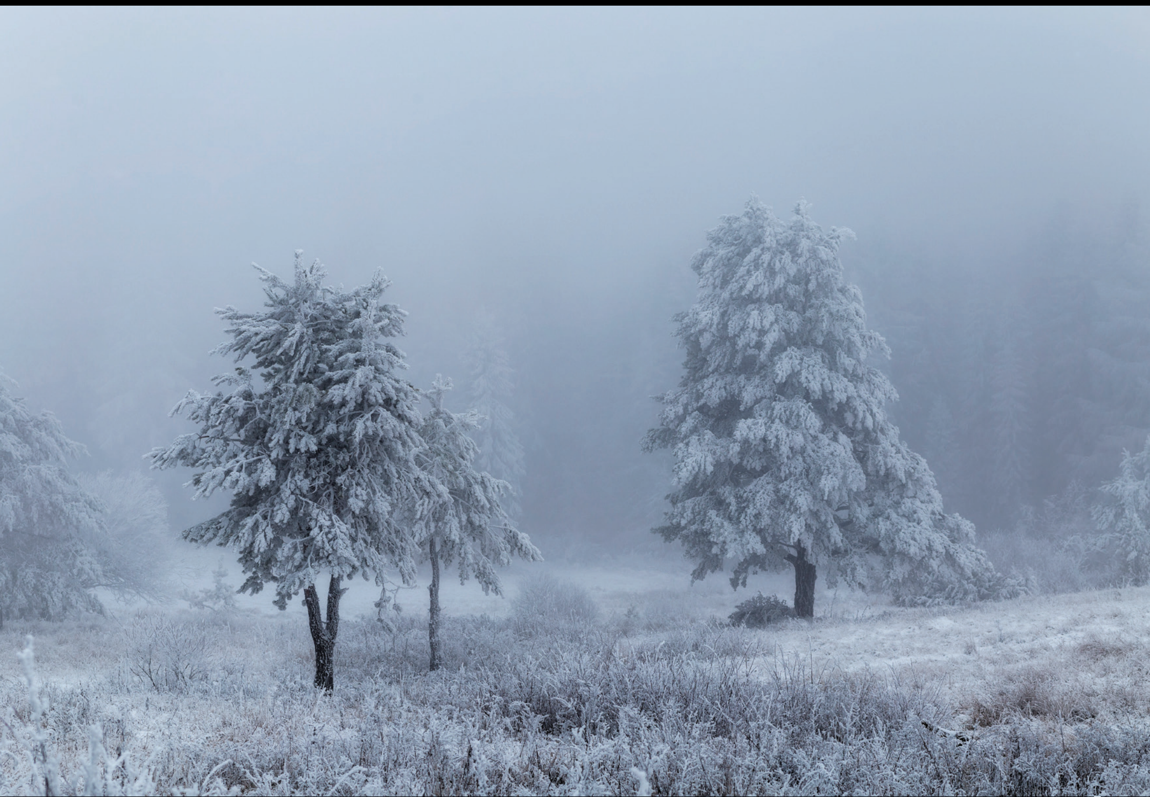
Zimowy krajobraz pogranicza Zimná panoráma pohraničnej oblasti Winter borderland landscape