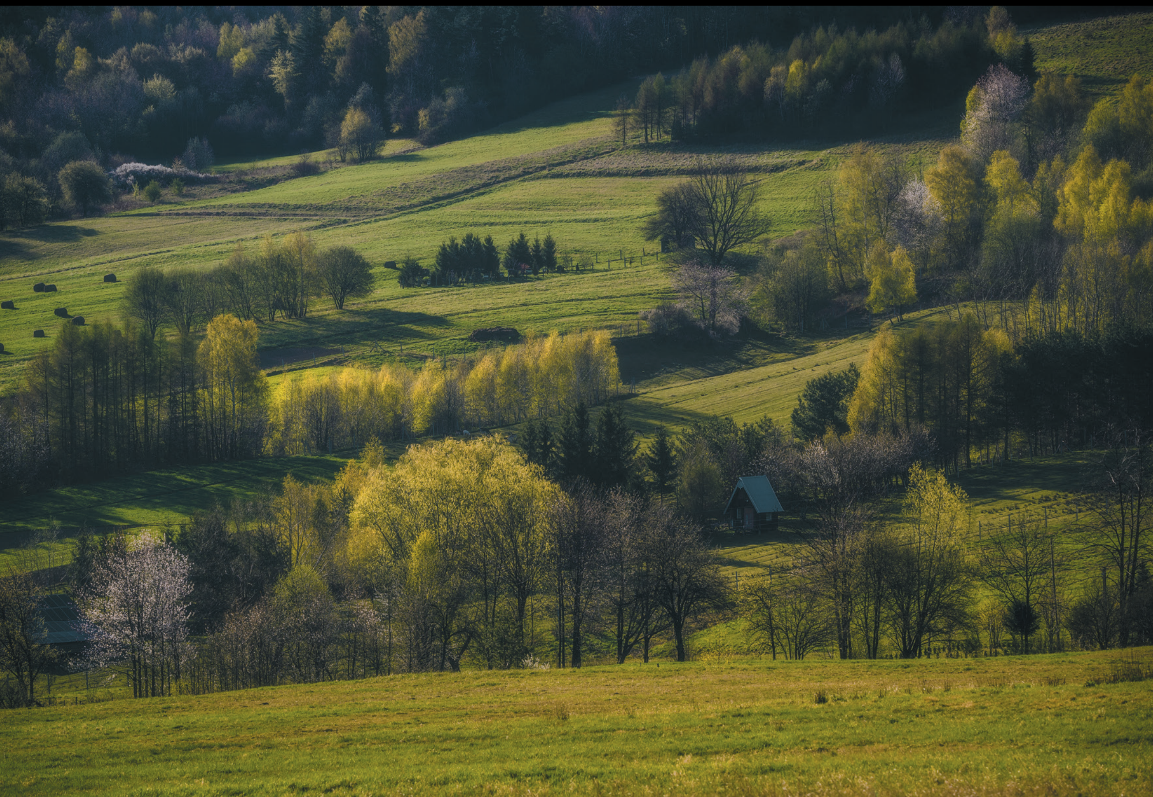
Wiosenny krajobraz pogranicza Jarná panoráma pohraničnej oblasti Spring borderland landscape