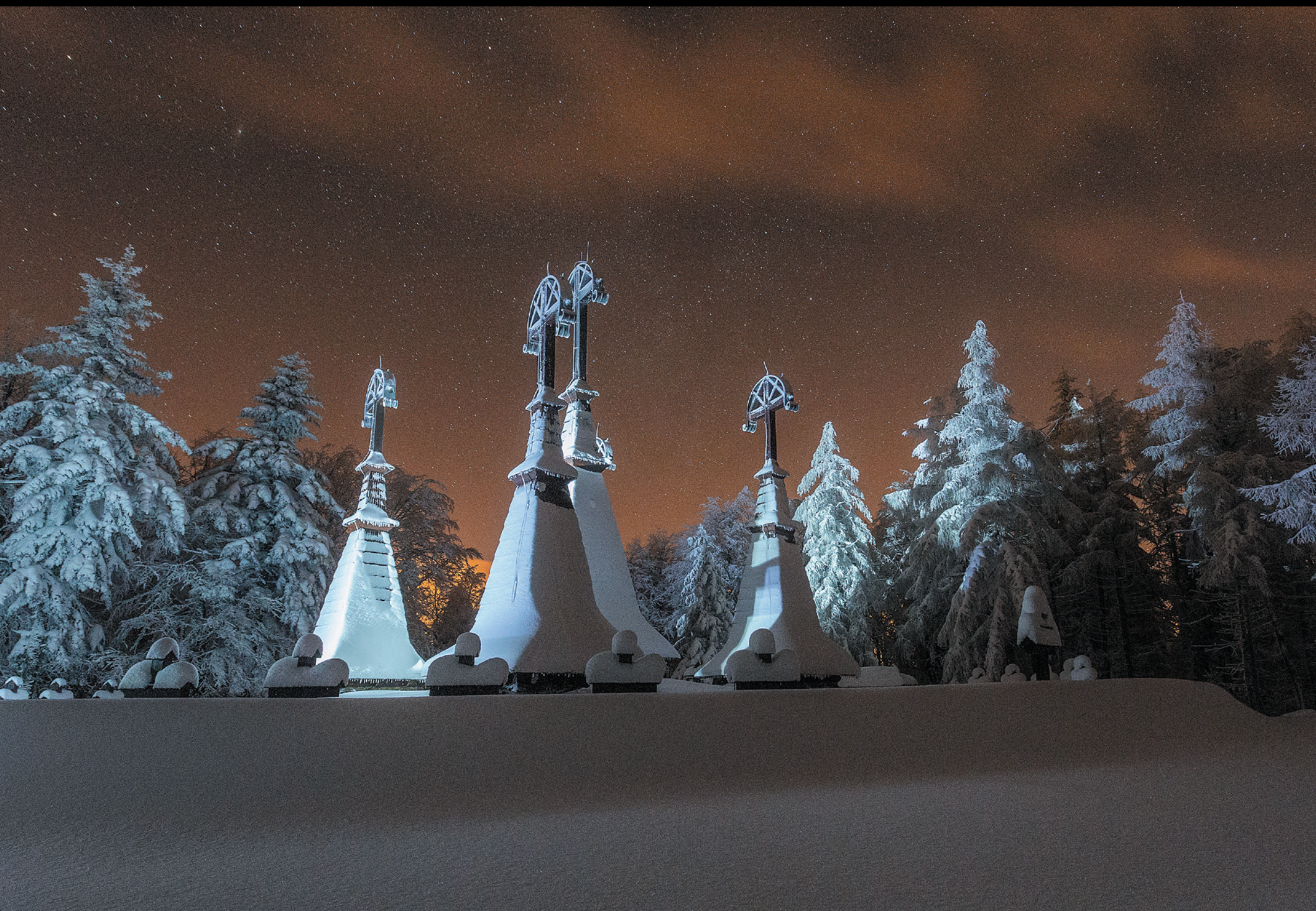
Cmentarz wojenny nr 51 Rotunda w Regietowie Vojenský cintorín č. 51 Rotunda v Regietove World War Cemetery No. 51 Rotunda in Regietów