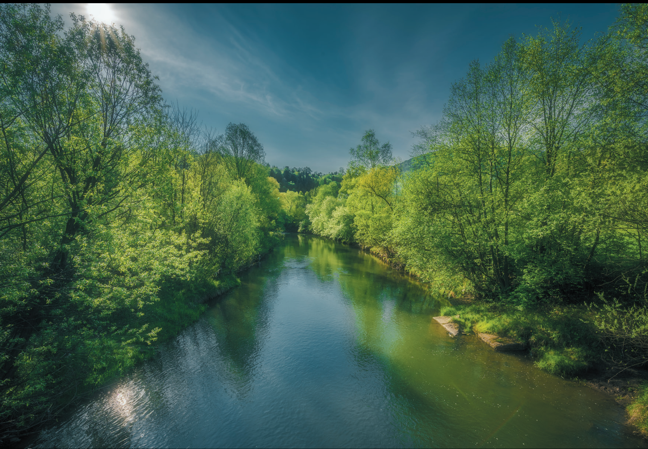
Rzeka Ropa w Szymbarku Rieka Ropa v Szymbarku The Ropa River in Szymbark