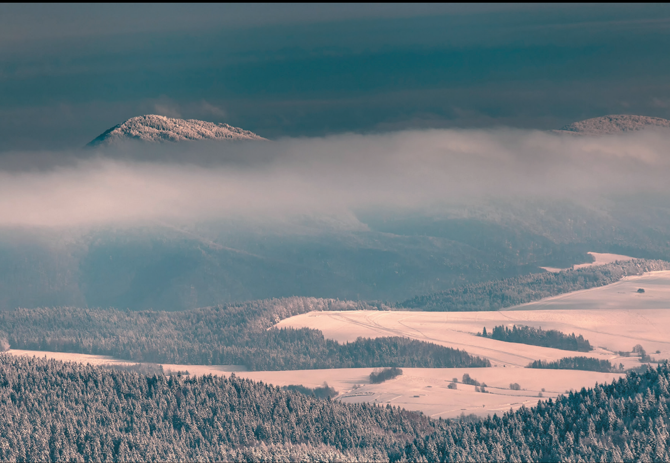
Busov 1002 m n.p.m. – najwyższy szczyt Beskidu Niskiego po stronie słowackiej Busov 1002 m n.m. – najvyšší vrch Nízkyh Beskýd na slovenskej strane Busov 1002 m above sea level – the highest peak of the Low Beskids on the Slovak side