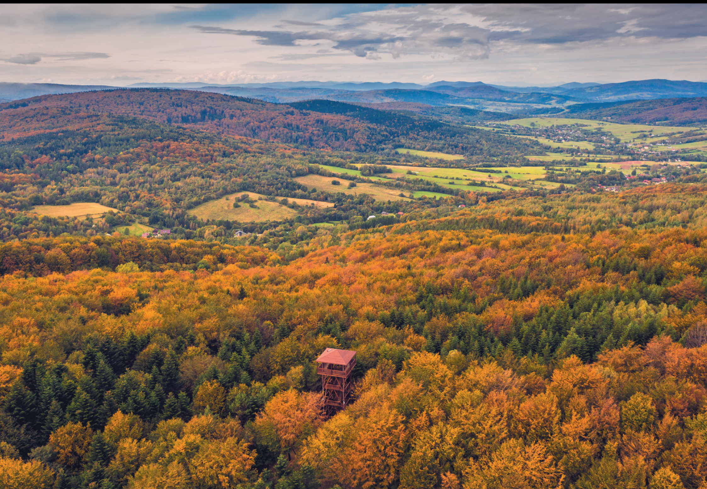
Wieża widokowa pod Ferdlem Vyhlídková veža pod Ferdlom The lookout tower at Ferdel