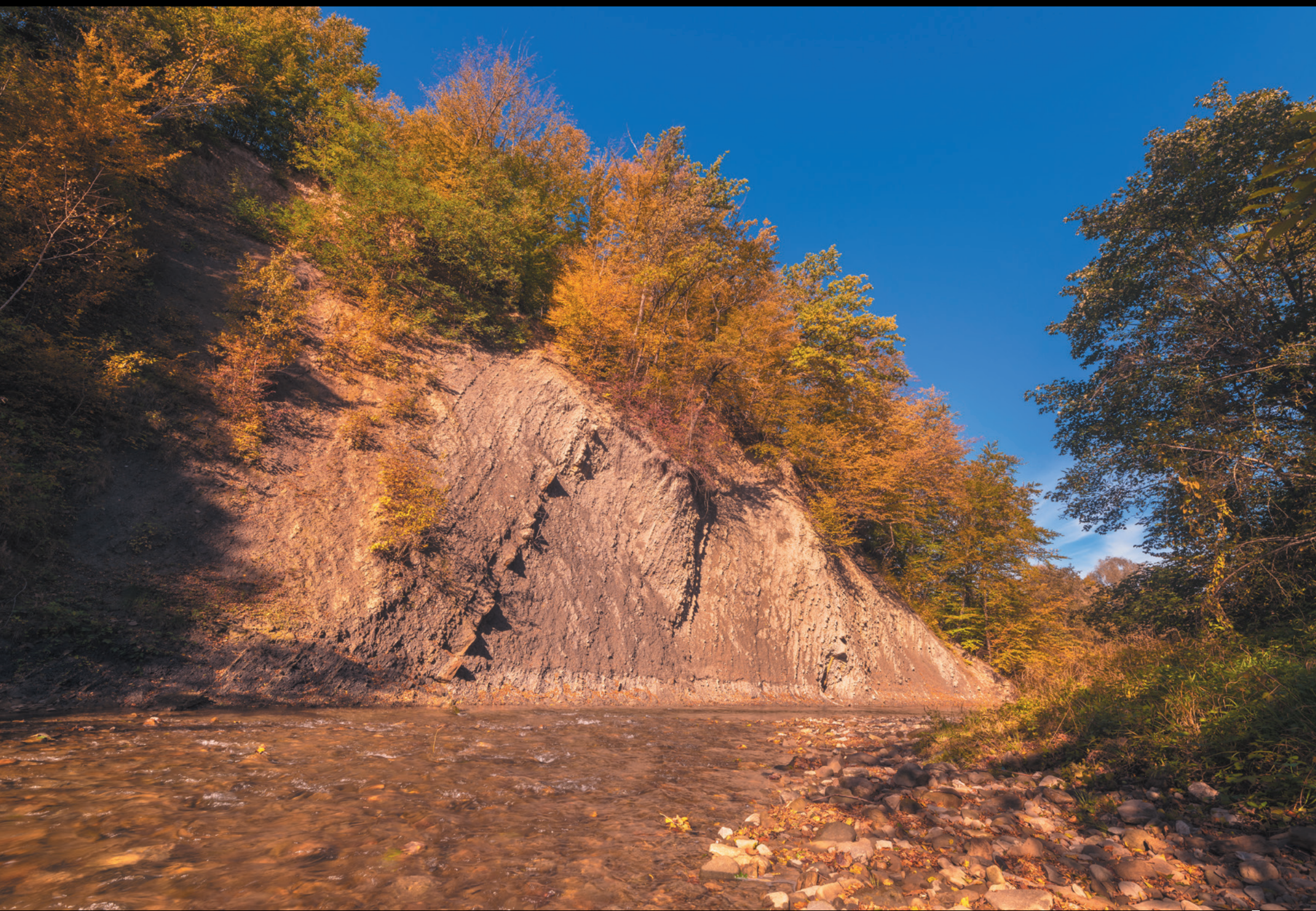
Odslonięcie fliszu karpackiego na rzece Sękówka Odkryv v karpatskom flyši na rieke Sękówka Outcrop of the Carpathian flysch on the Sękówka river