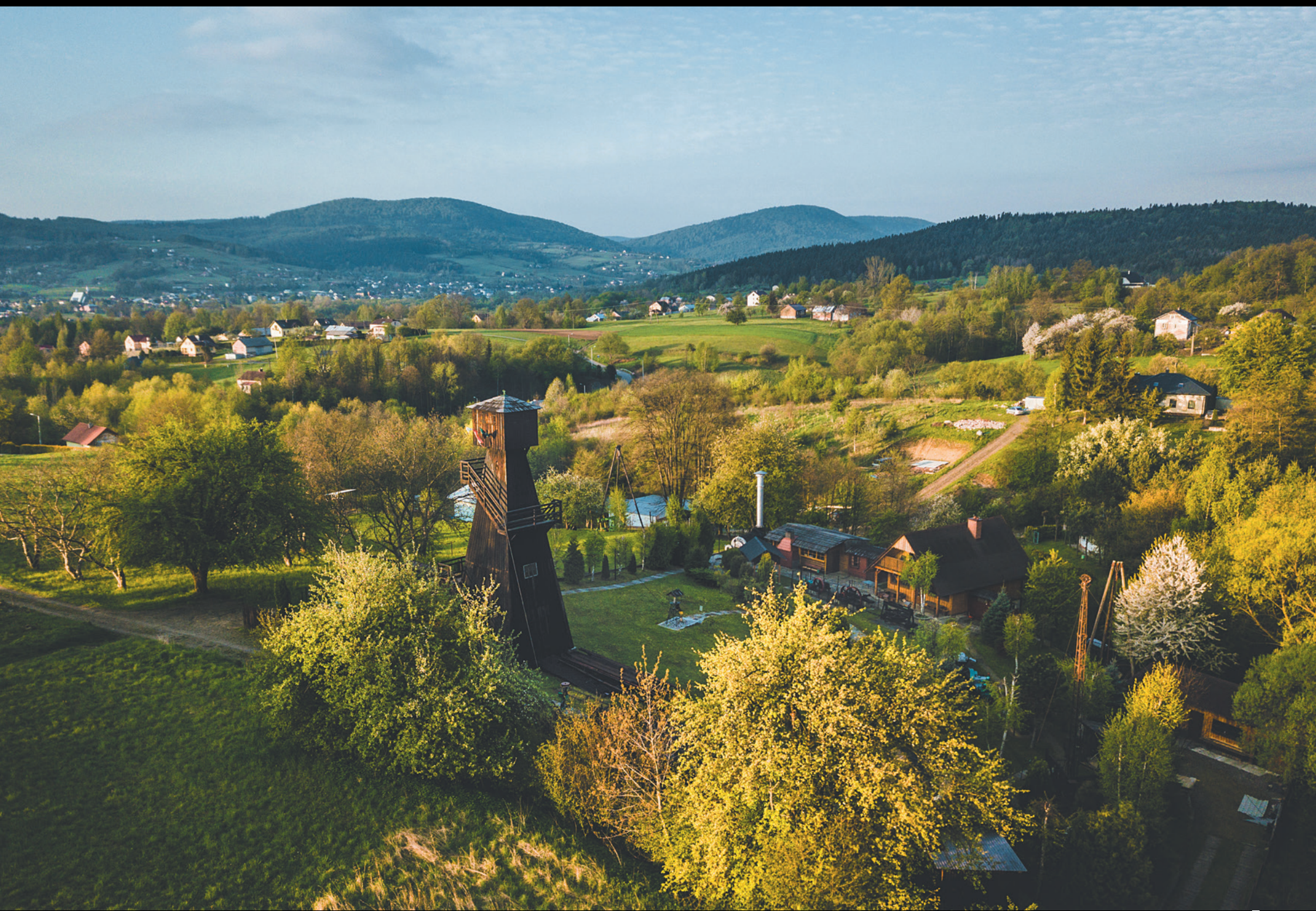
Skansen Przemysłu Naftowego „Magdalena” w Gorlicach Skanzen ropného priemyslu „Magdalena” v Gorliciach The Open-Air Museum of the Oil Industry „Magdalena” in Gorlice