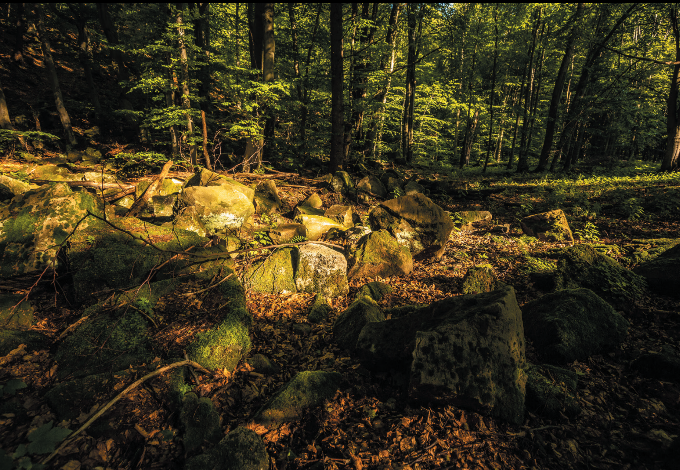
Pozostałości kamieniołomu na Maguryczu Dużym Zvyšky kameňolomu na Veľkom Maguryczu The remains of a quarry in Magurycz Duży