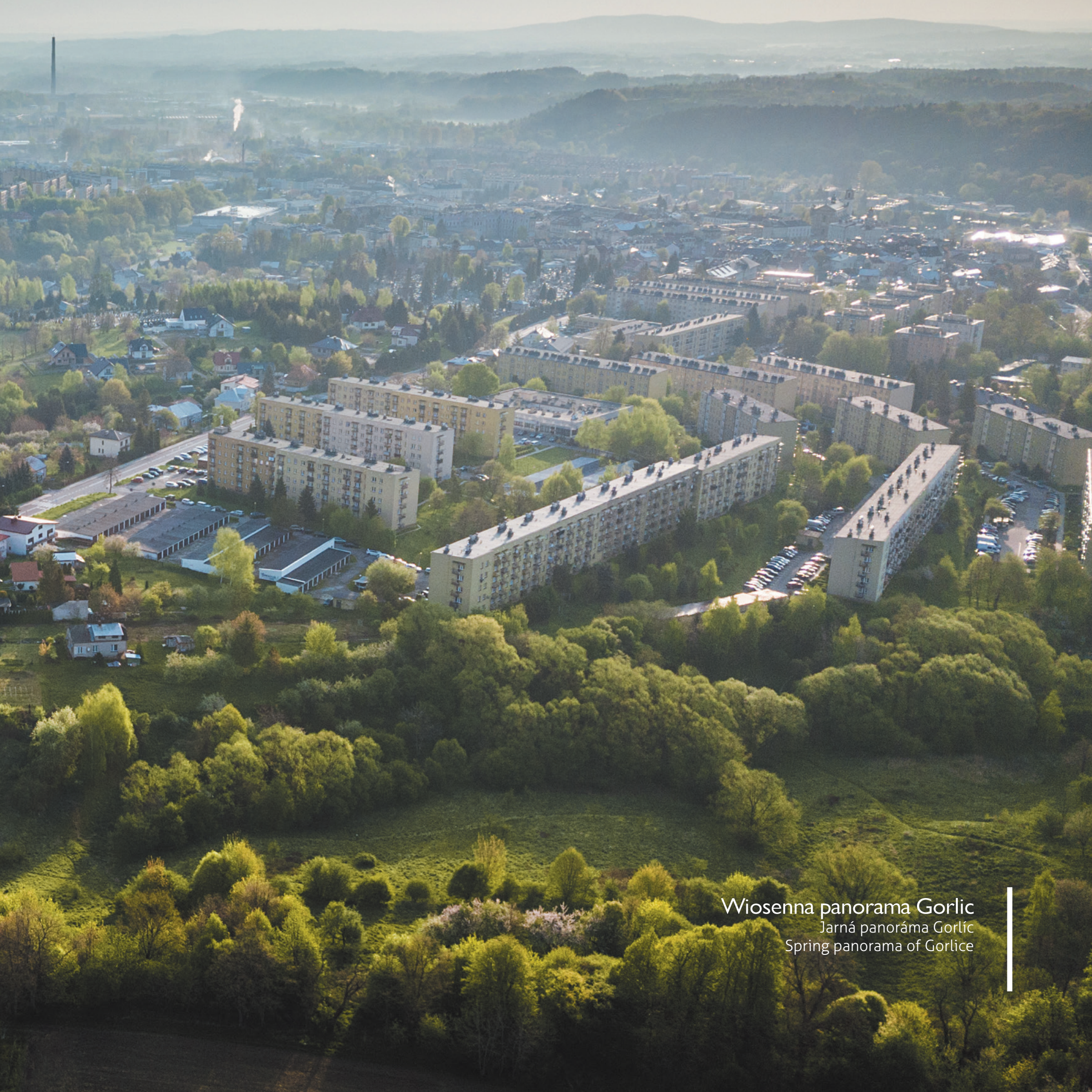
Wiosenna panorama Gorlic Jarná panoráma Gorlíc Spring panorama of Gorlice