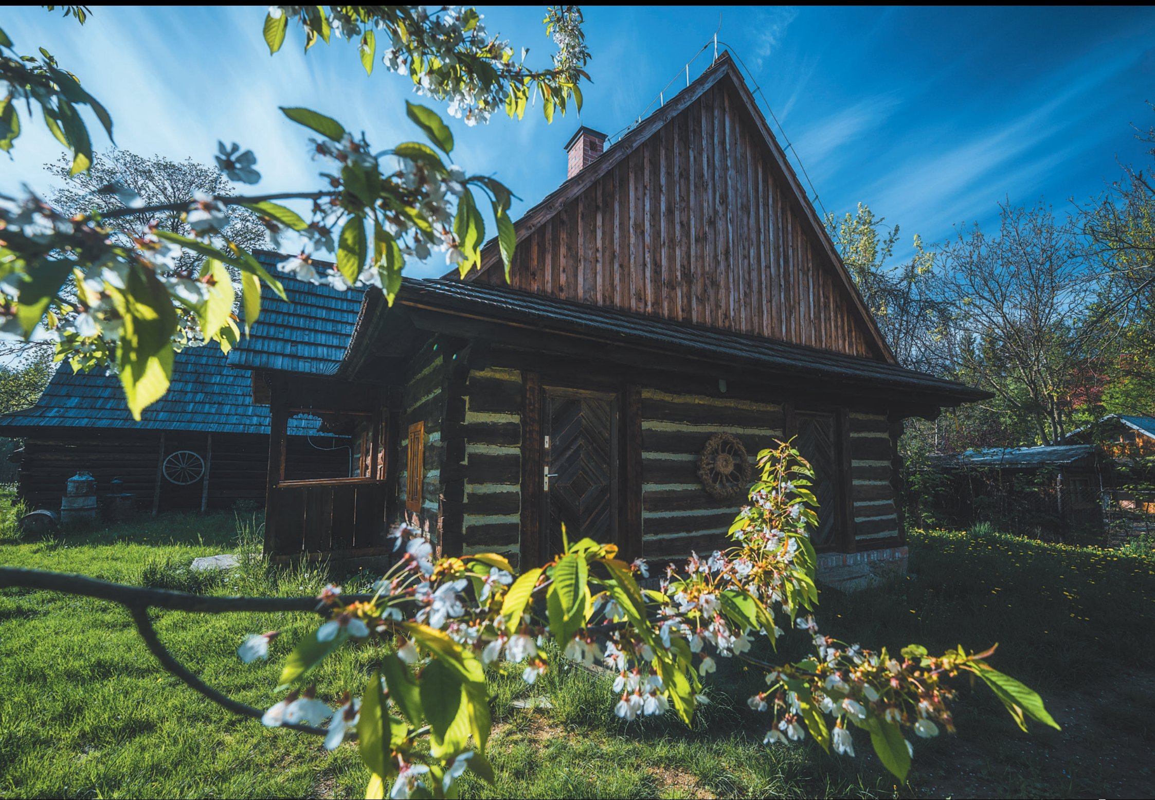
Skansen „Zagroda Maziarska” w Łosiu Gazdovský dvor kolomažníka v obci Łosie The open-air museum „Zagroda Maziarska” in Łosie