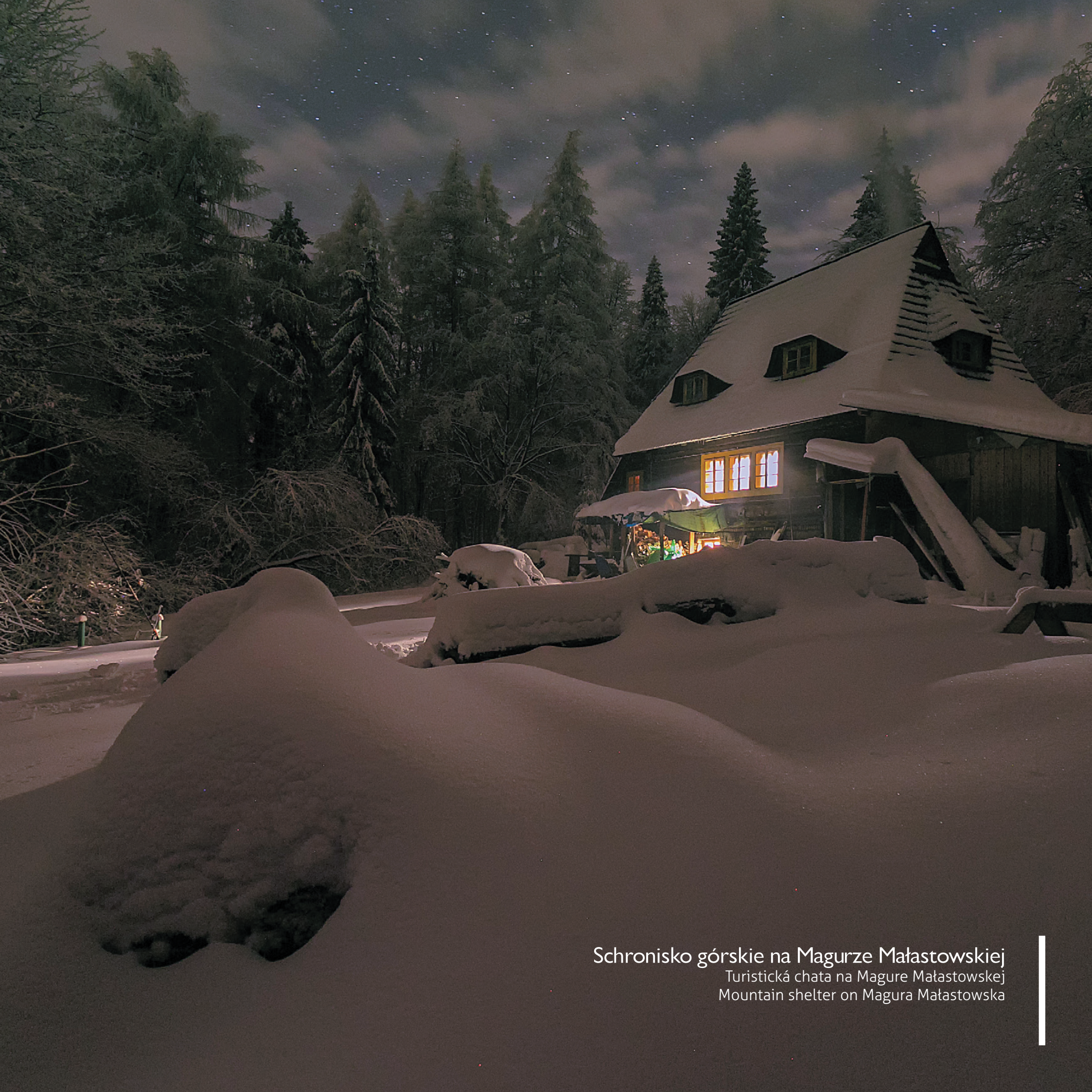
Schronisko górskie na Magurze Małastowskiej Turistická chata na Magure Małastowskej Mountain shelter on Magura Małastowska