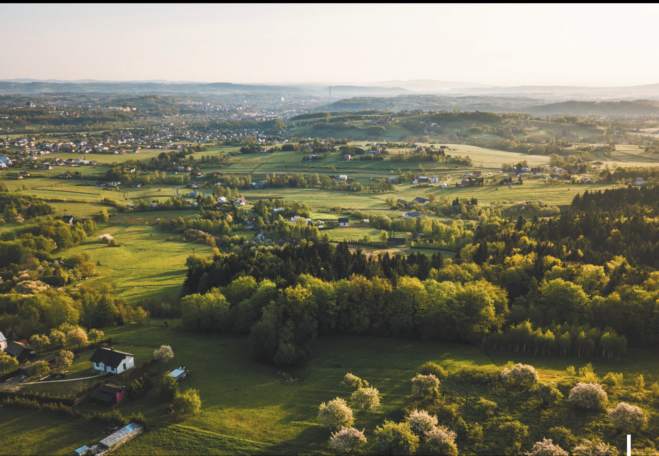
Wiosenna panorama doliny Ropy Jarná panoráma doliny Ropy Spring panorama of the Ropa valley