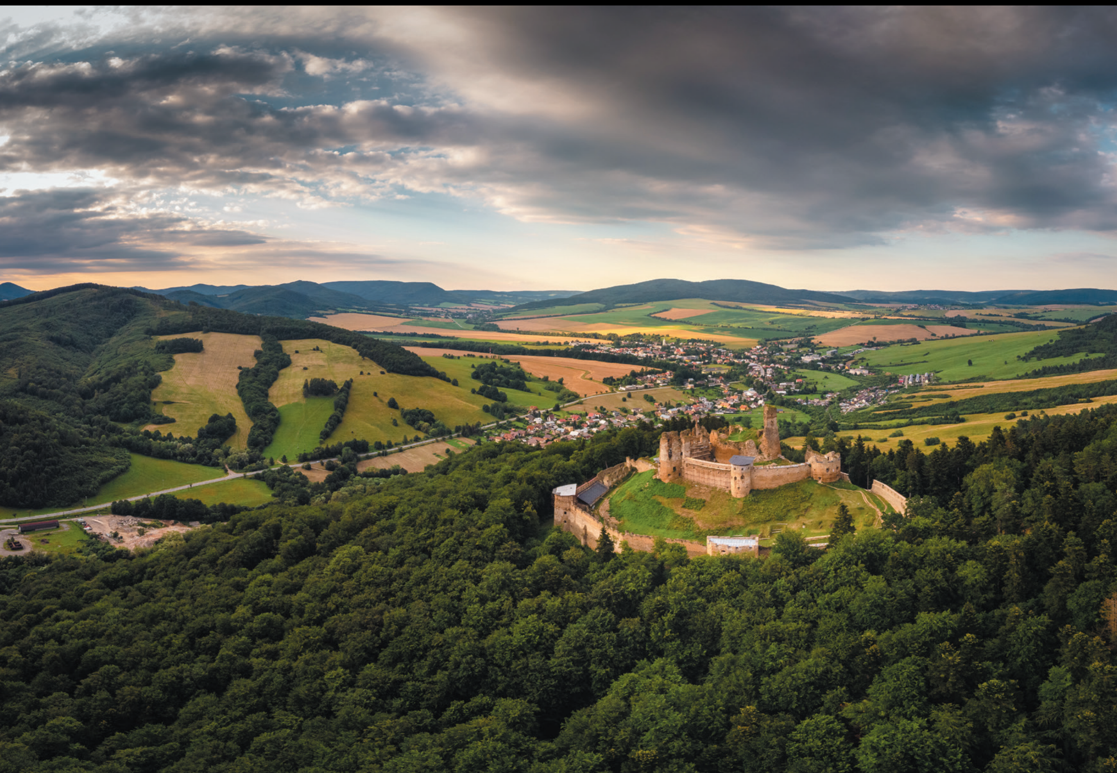
Ruiny zamku w Zborowie Zrúcanina hradu v Zborove The ruins of the castle in Zborów