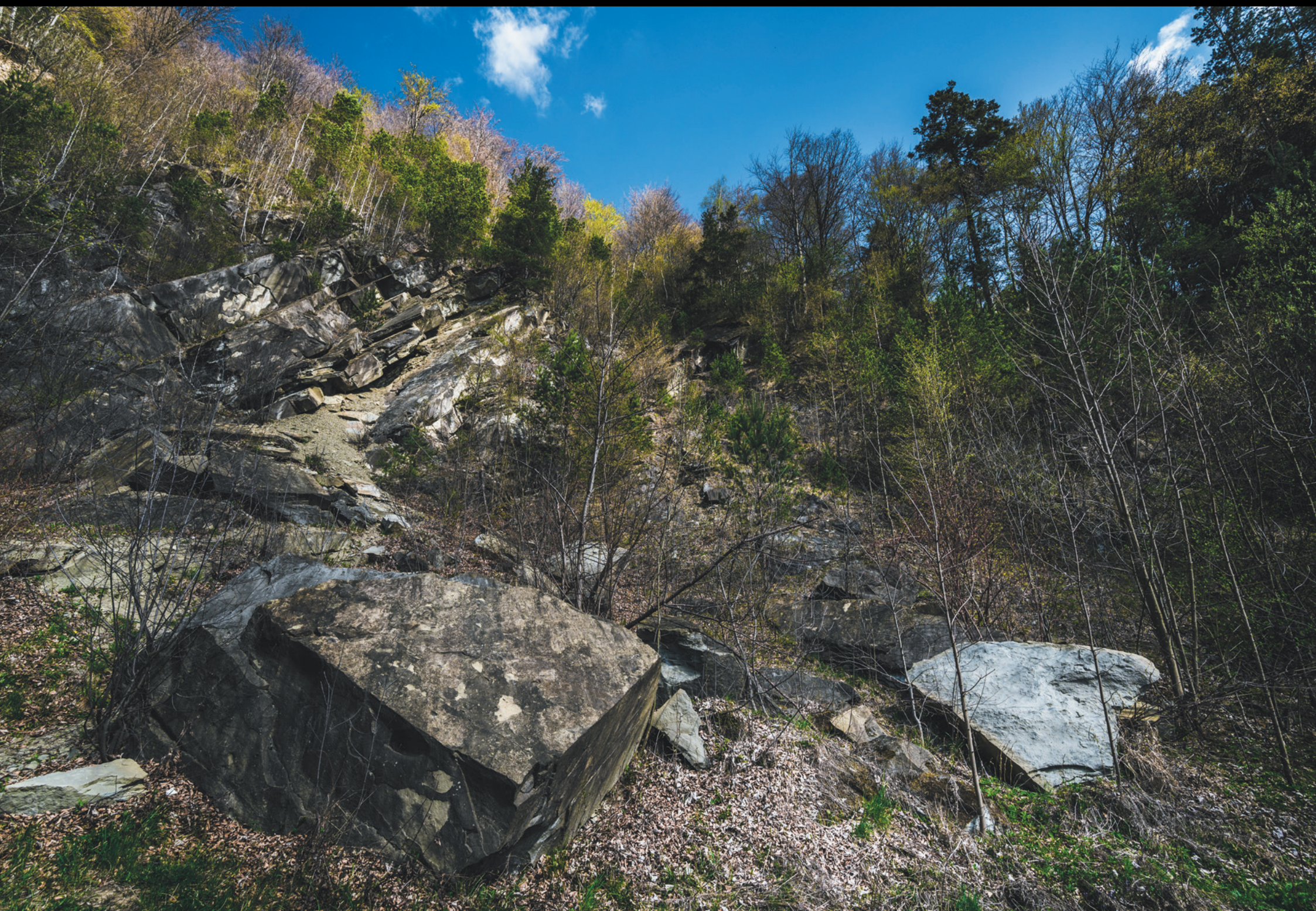
Pozostałości kamieniołomu w Łosiu Zvyšky kameňolomu v obci Łosie The remains of a quarry in Łosie