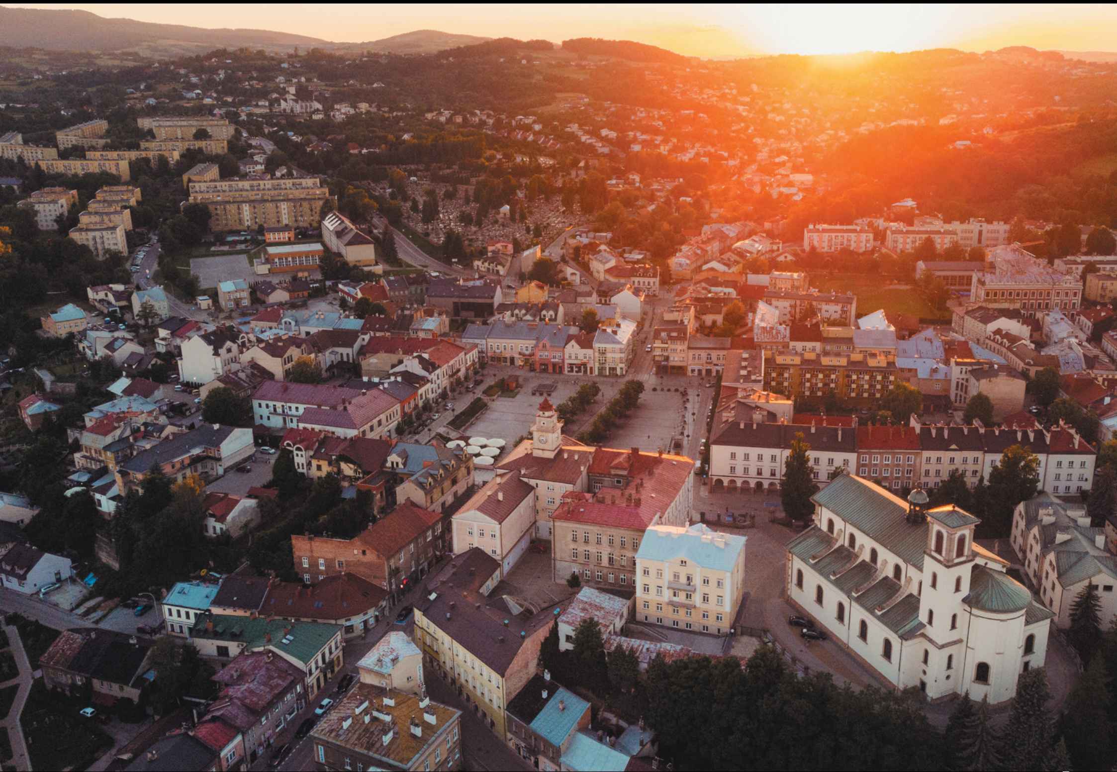
Gorlice – widok na centrum miasta z lotu ptaka Gorlice – pohľad na centrum mesta z vtáčej perspektívy Gorlice – bird's eye view of the city center