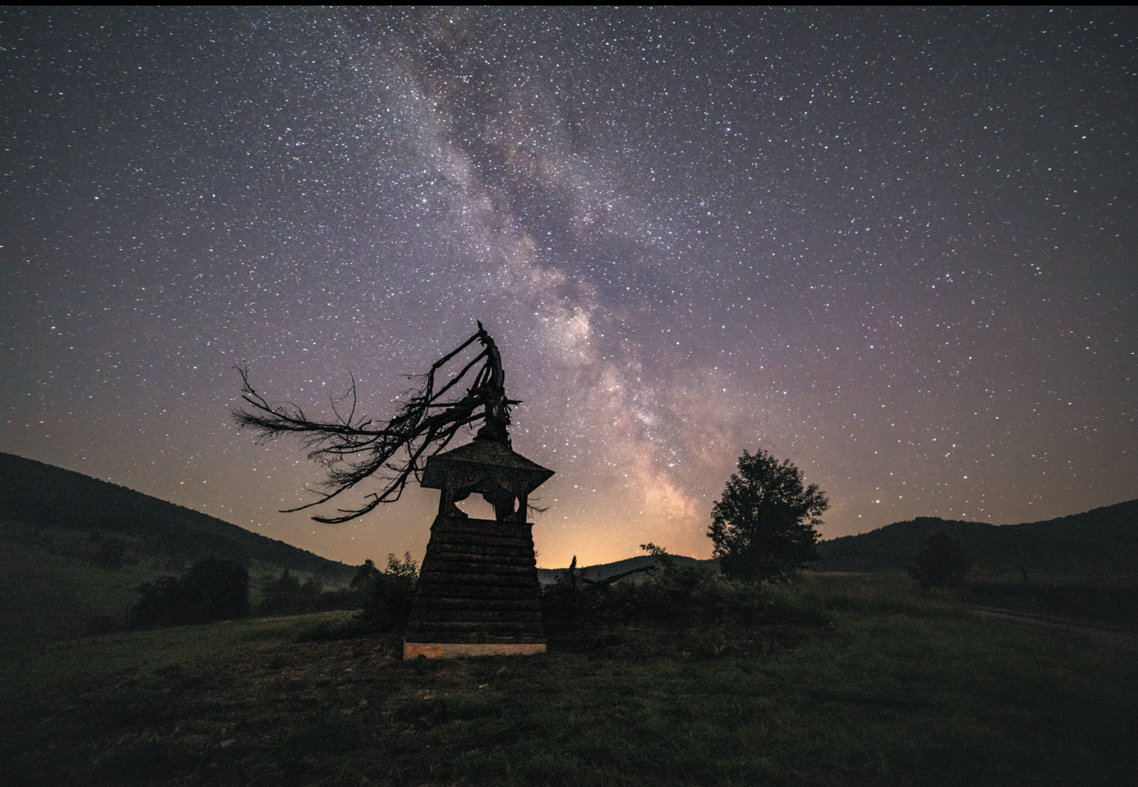
Dzwonnica w Regietowie Wyżnym Zvonica v Regietowe Wyžnom Belfry in Regietów Wyżny