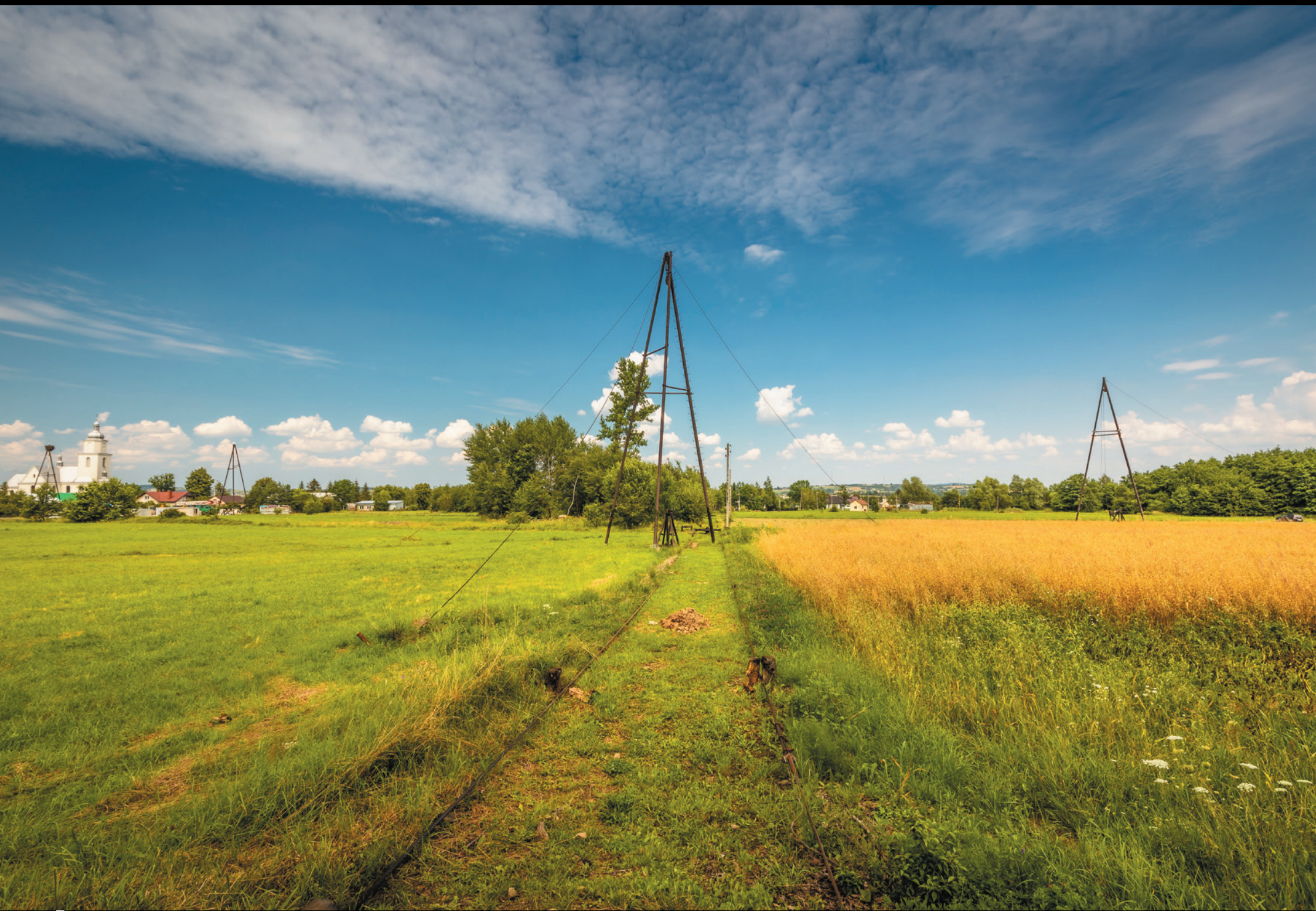
Krajobraz naftowy w Krygu Ropná panoráma krajiny v obci Kryg Crude oil landscape in Kryg