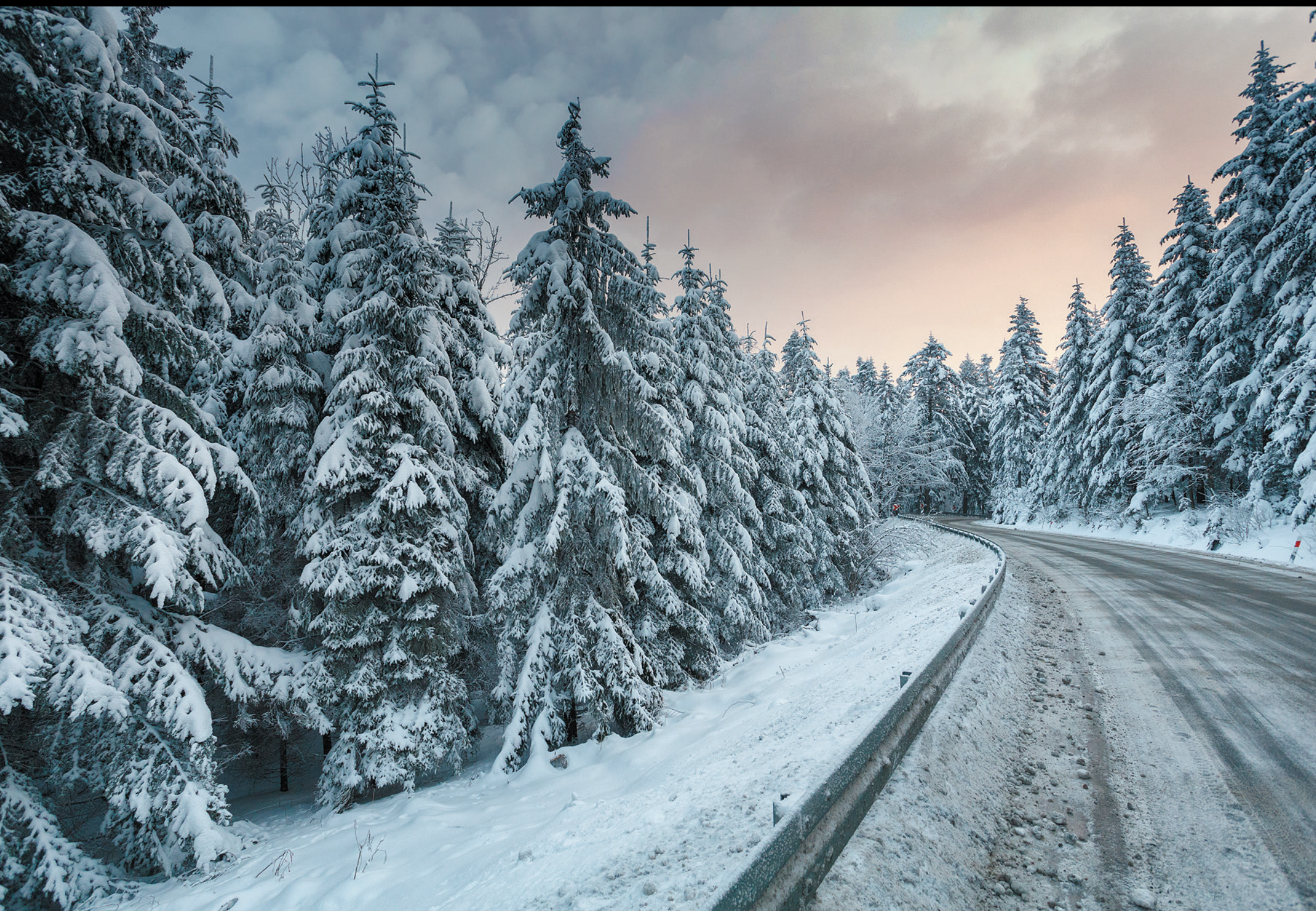
Droga łącząca Gorlice i Bardejów – zimowy podjazd pod Magurę Małastowską Cesta, ktorá spája Gorlice a Bardejov – úsek cesty na Maguru Małastowsku v zime The road connecting Gorlice and Bardejów – winter driveway to Magura Małastowska