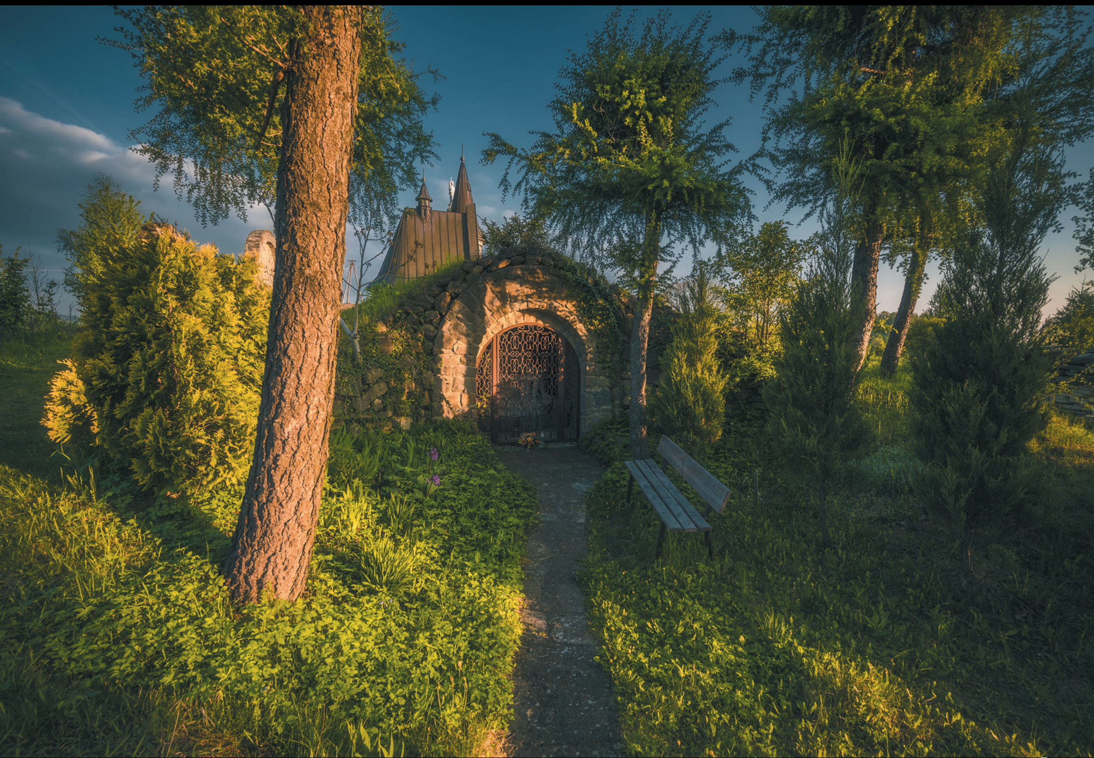
Gorlicka Golgota Gorlická kalvária Gorlice Golgotha