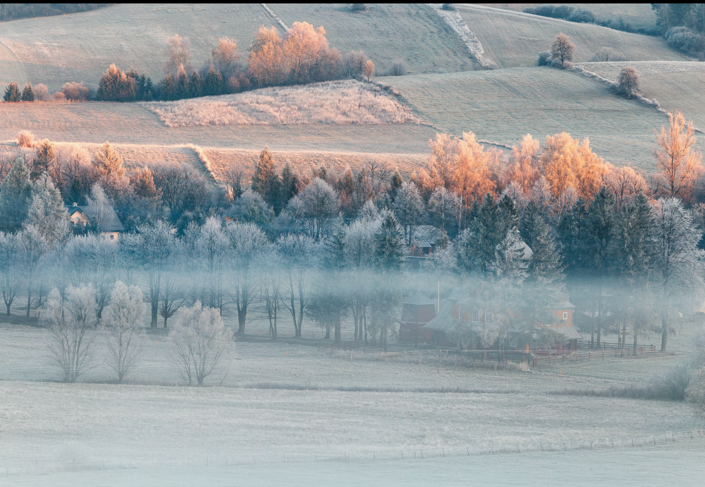
Zimowy poranek w Gładyszowie Zimné ráno v Gładyszowe Winter morning in Gładyszów