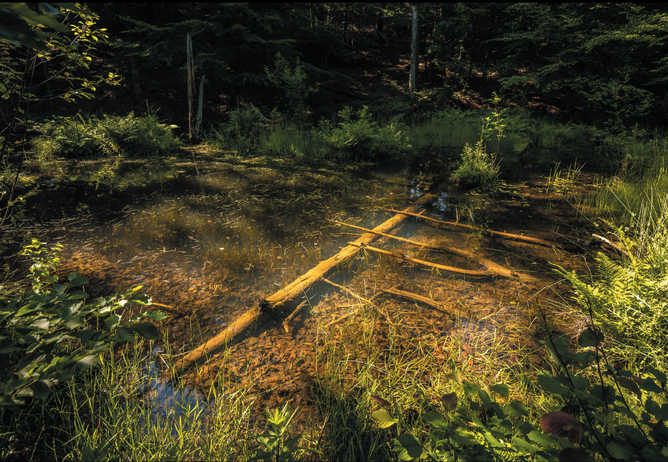
Jeziorko osuwiskowe w Radocynie Zosuvné jazierko v Radocyne A landslide lake in Radocyna