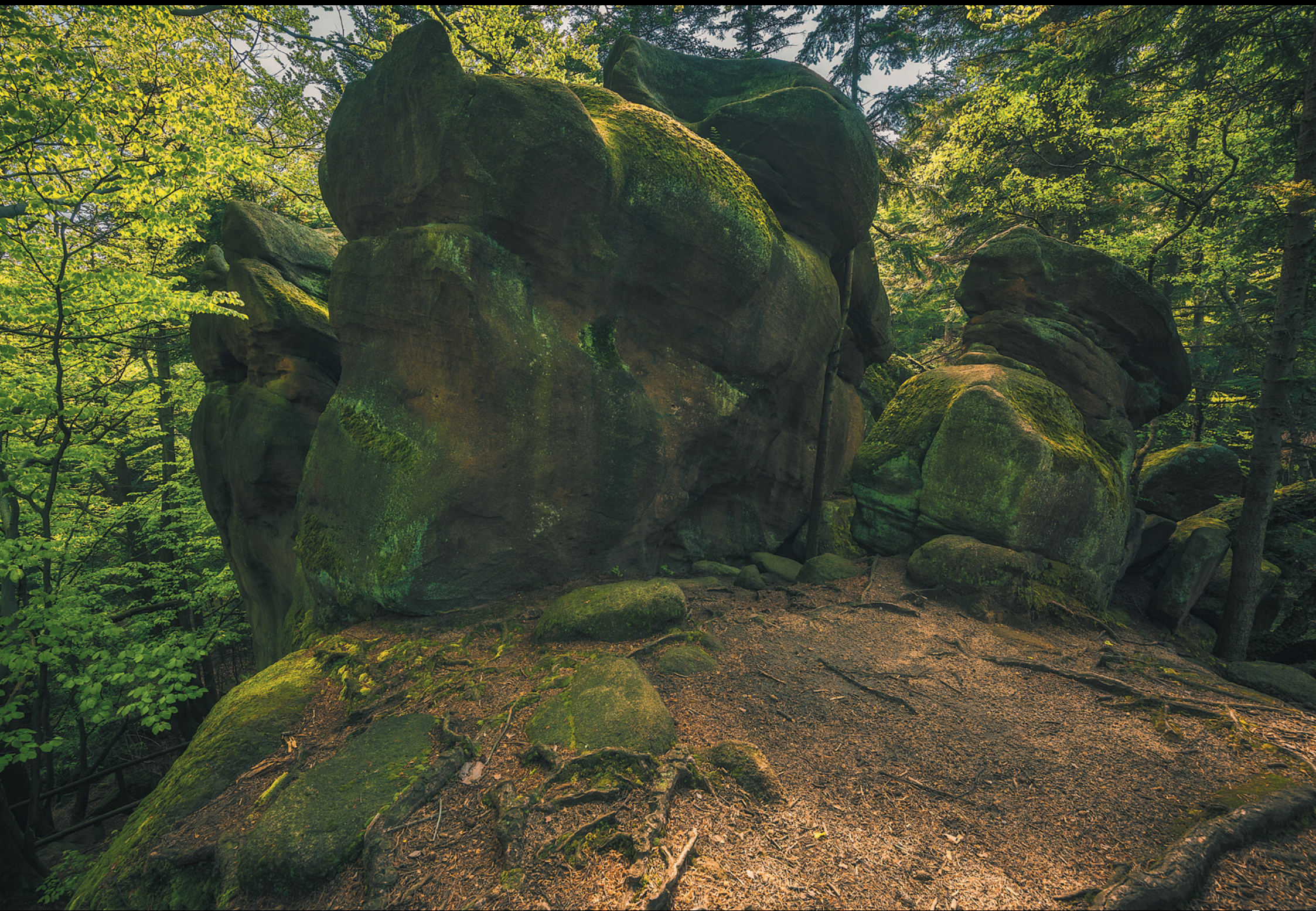
Rezerwat „Diabli Kamień” Přírodní rezervácia „Diabolský kameň” „Diabli Kamień” reserve