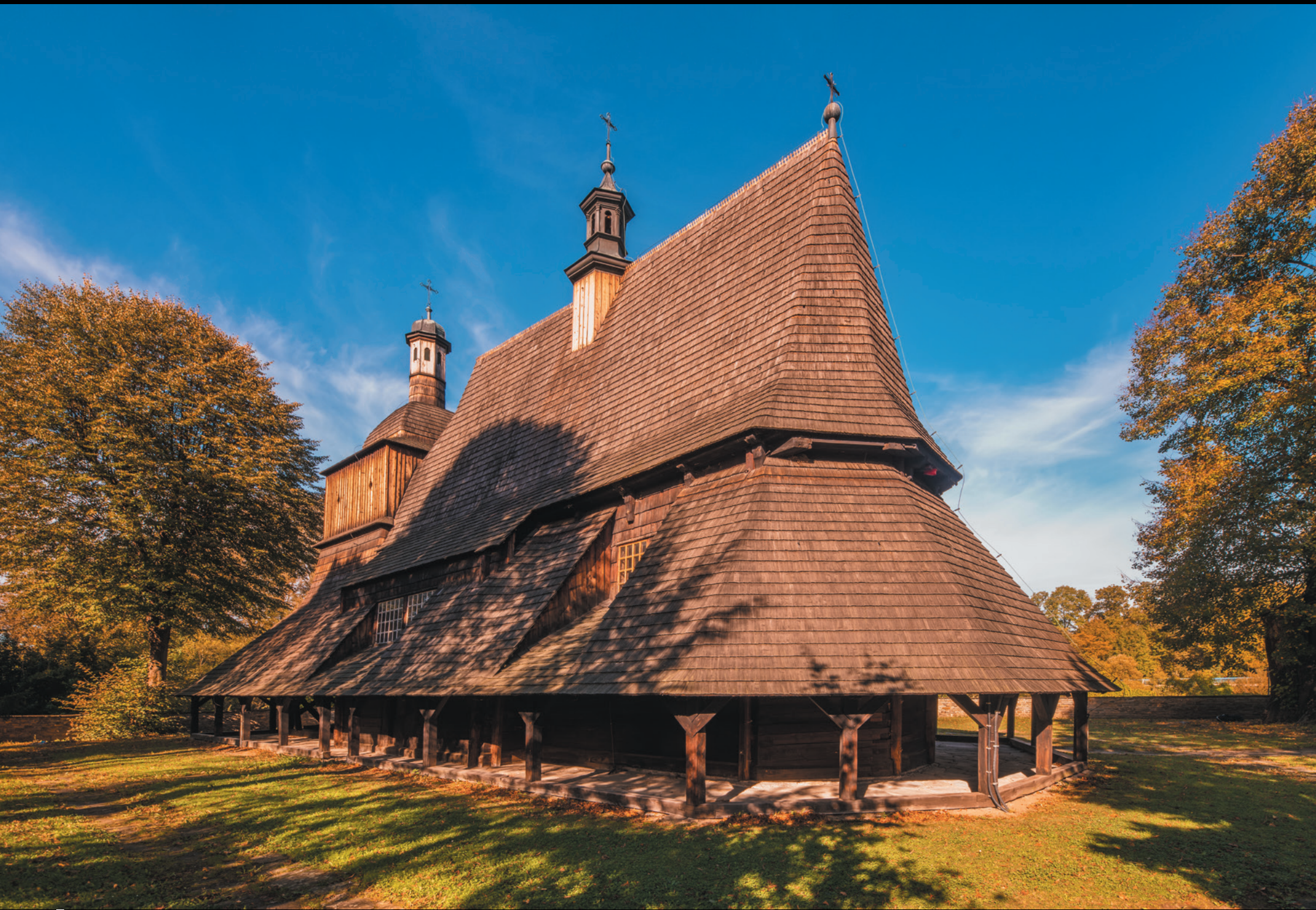
Kościół pw. św. św. Apostołów Filipa i Jakuba w Sękowej Kostol svätých apoštolov Filipa a Jakuba v Sękowej The Filial Church of St. Philip and St. Jacob in Sękowa