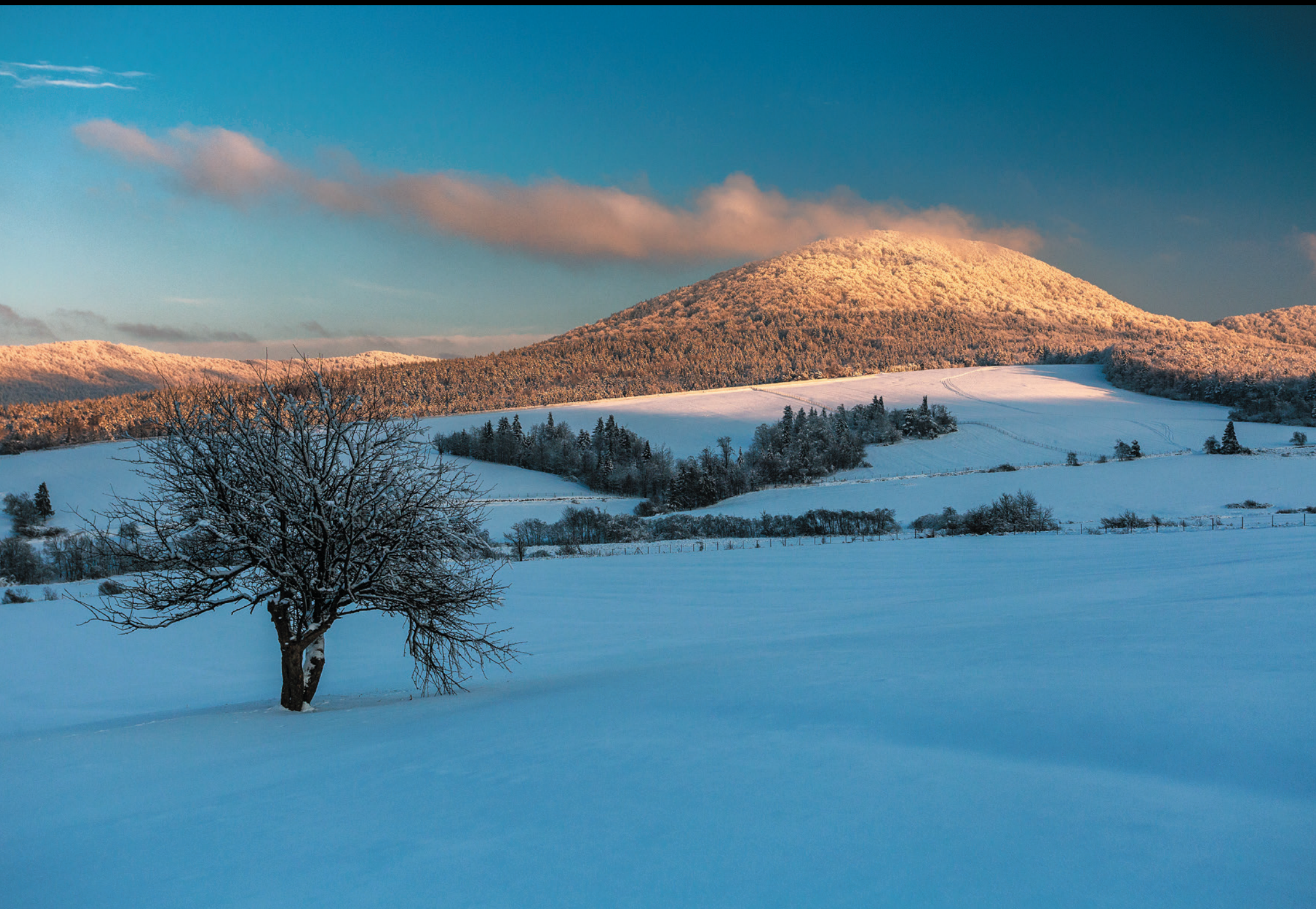
Lackowa 997 m n.p.m. – najwyższy szczyt Beskidu Niskiego po stronie polskiej Lackowa 997 m n.m. – nejvyšší vrch Nízkých Beskýd na polskéj strane Lackowa 997 m above sea level – the highest peak of the Beskid Niski on the Polish side