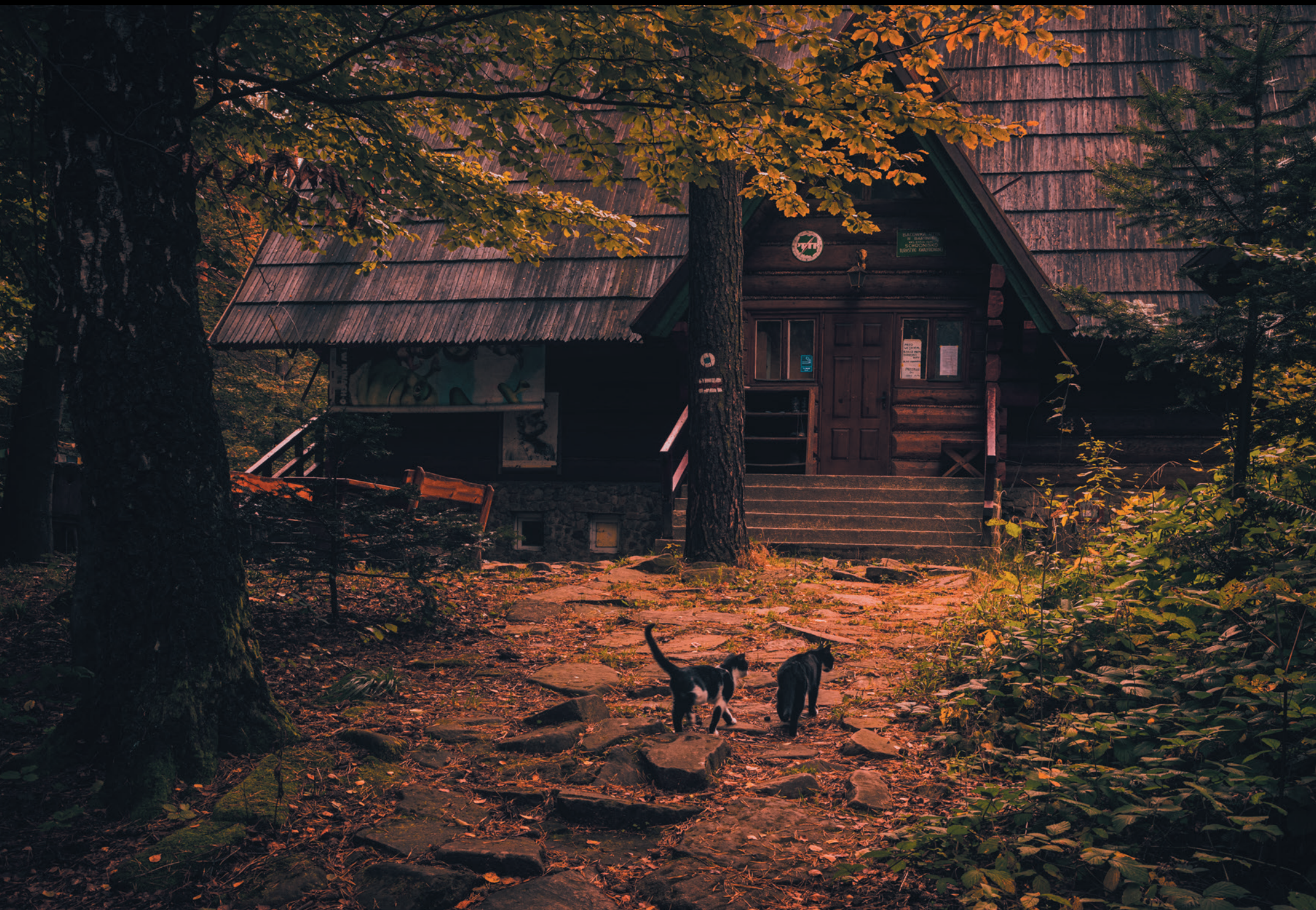
Schronisko w Bartnem Turistická chata v Bartnom Mountain shelter in Bartne