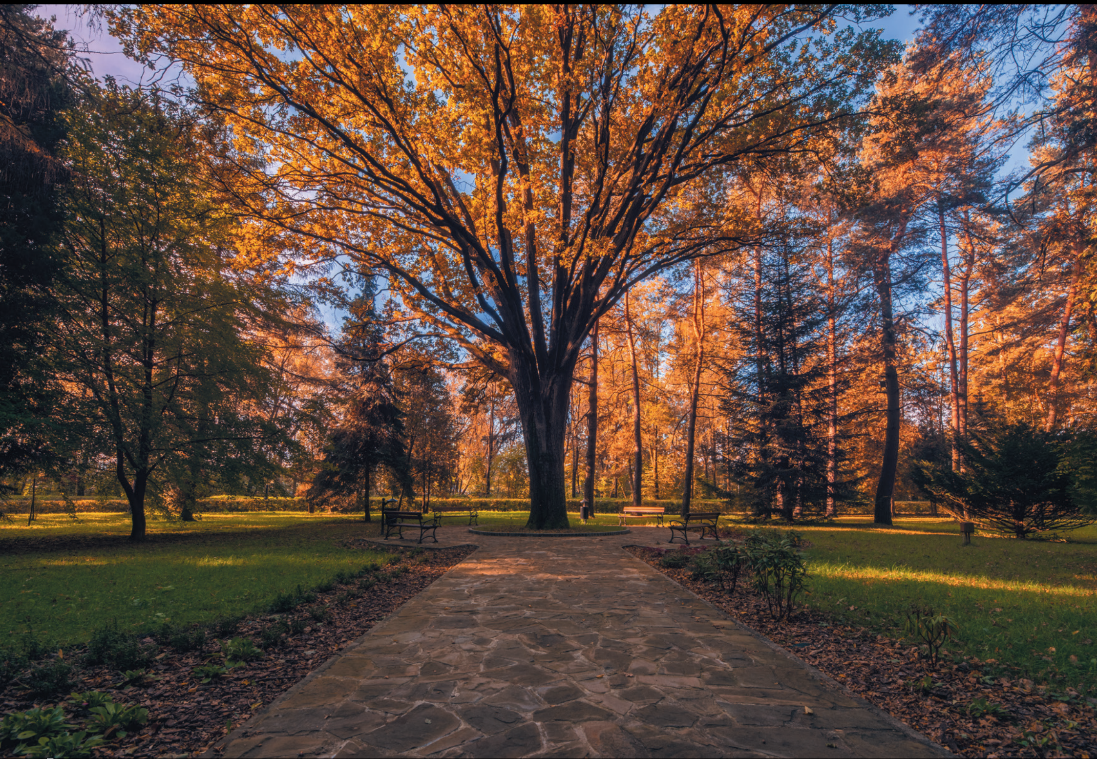
Park Miejski im. Wojciecha Biechońskiego w Gorlicach Mestský park Wojciecha Biechoňského v Gorliciach Wojciech Biechoński Town Park in Gorlice