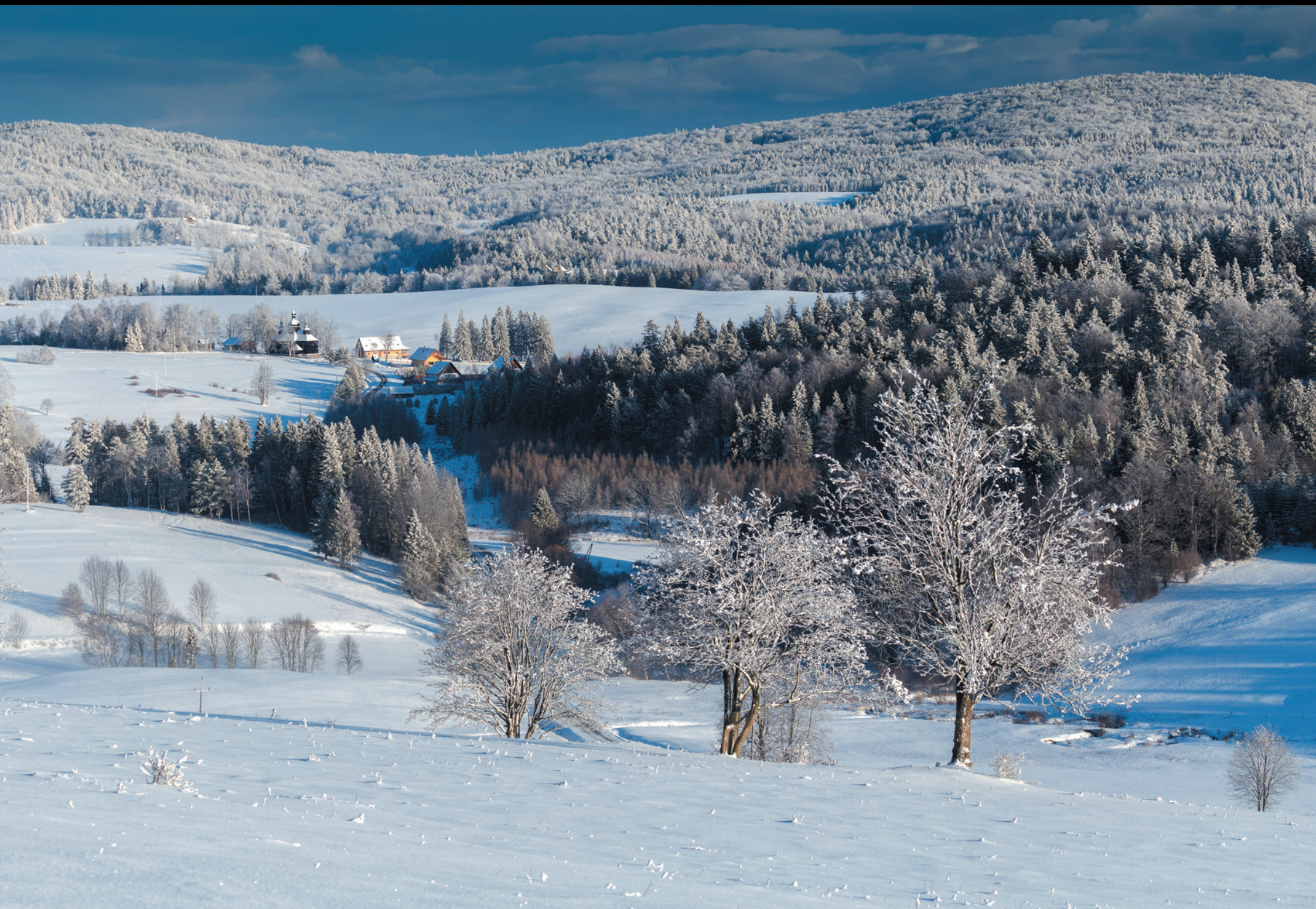
Widok w kierunku Krzywej Pohľad smerom na Krzywú View towards the Krzywa village