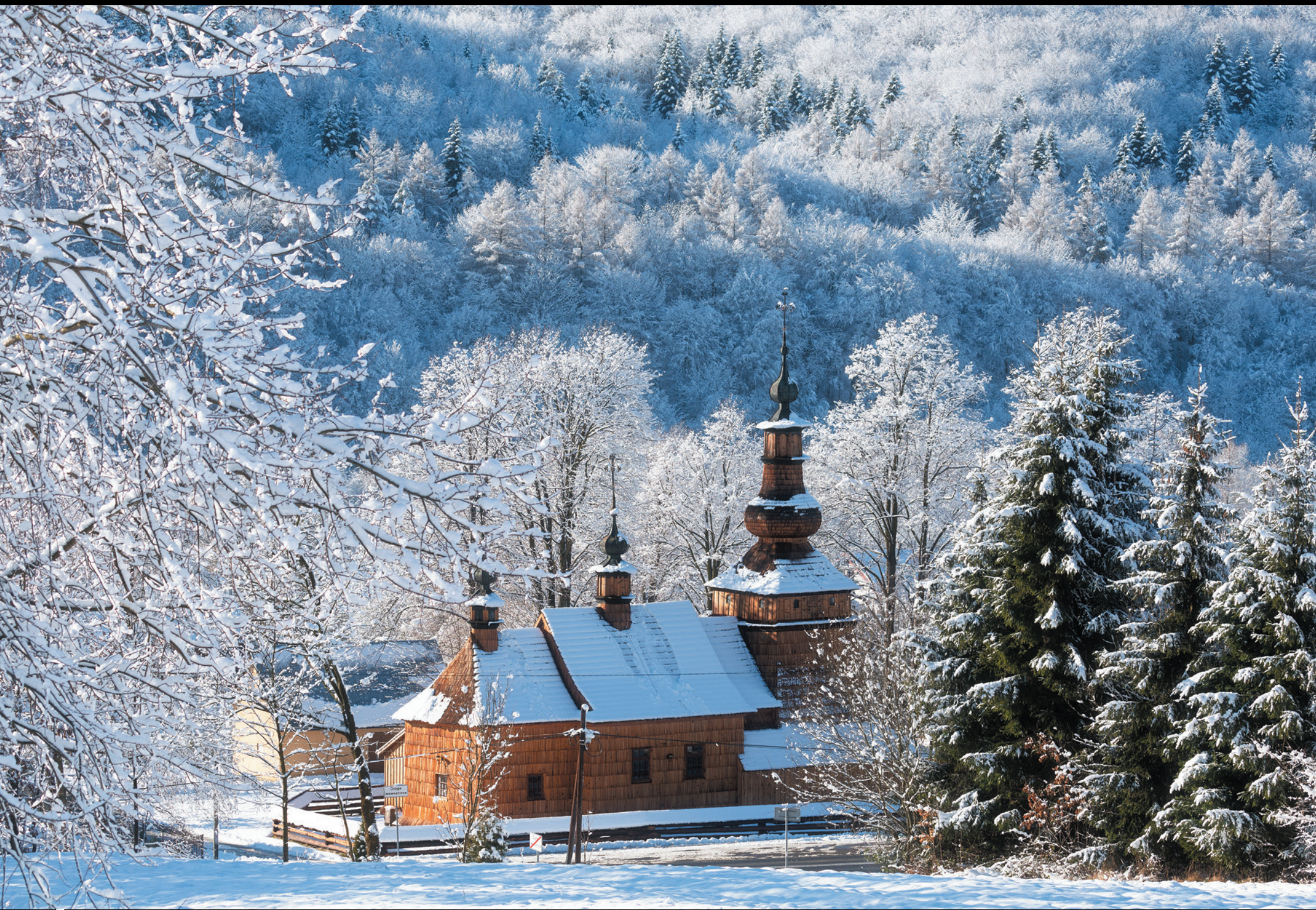
Cerkiew pw. św. Michała Archanioła w Ropicy Górnej Chrám sv. Michala Archanjela v Ropici Górnej The Greek Catholic Filial Church of St. Michael the Archangel in Ropica Górna