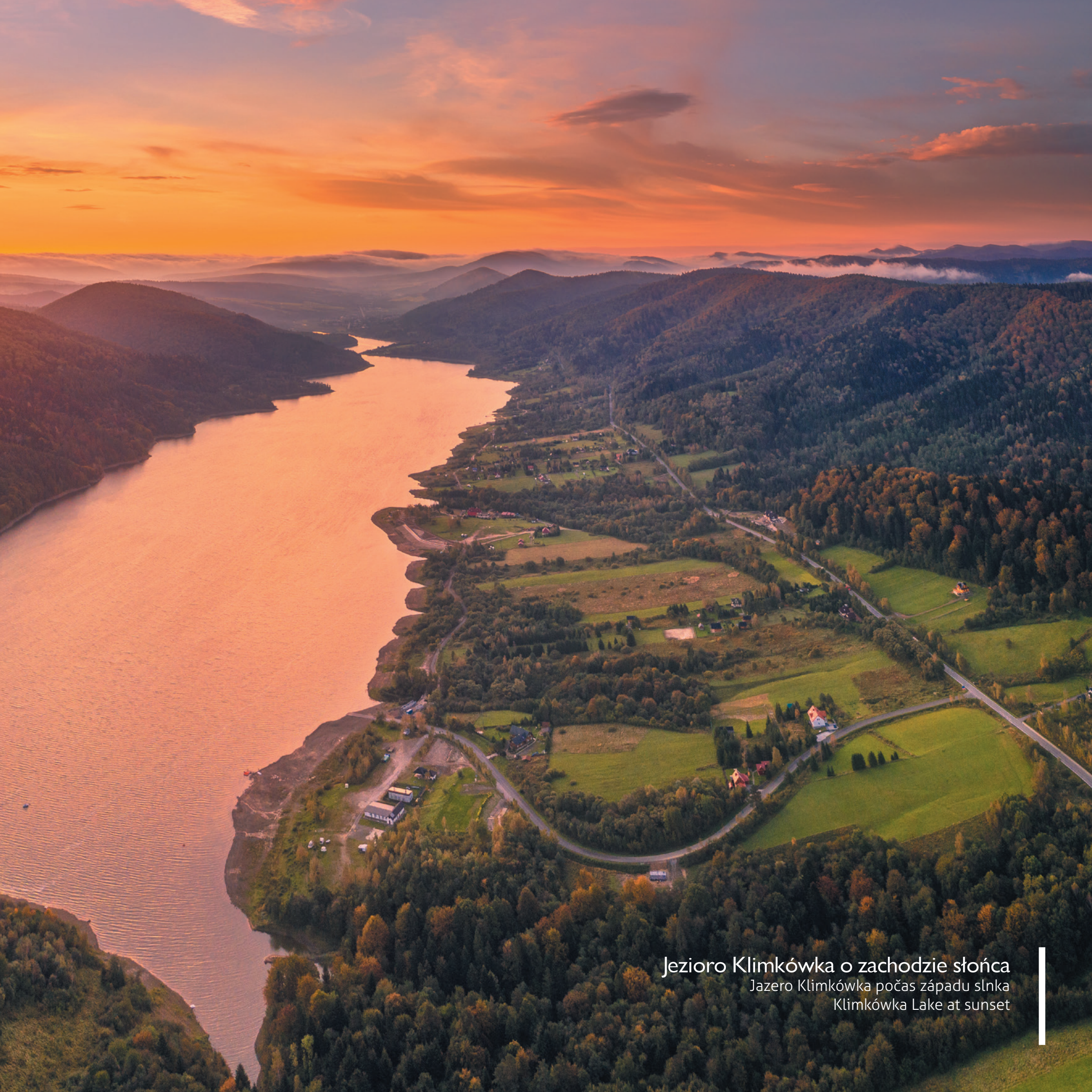
Jezioro Klimkówka o zachodzie słońca Jazero Klimkówka počas západu slnka Klimkówka Lake at sunset