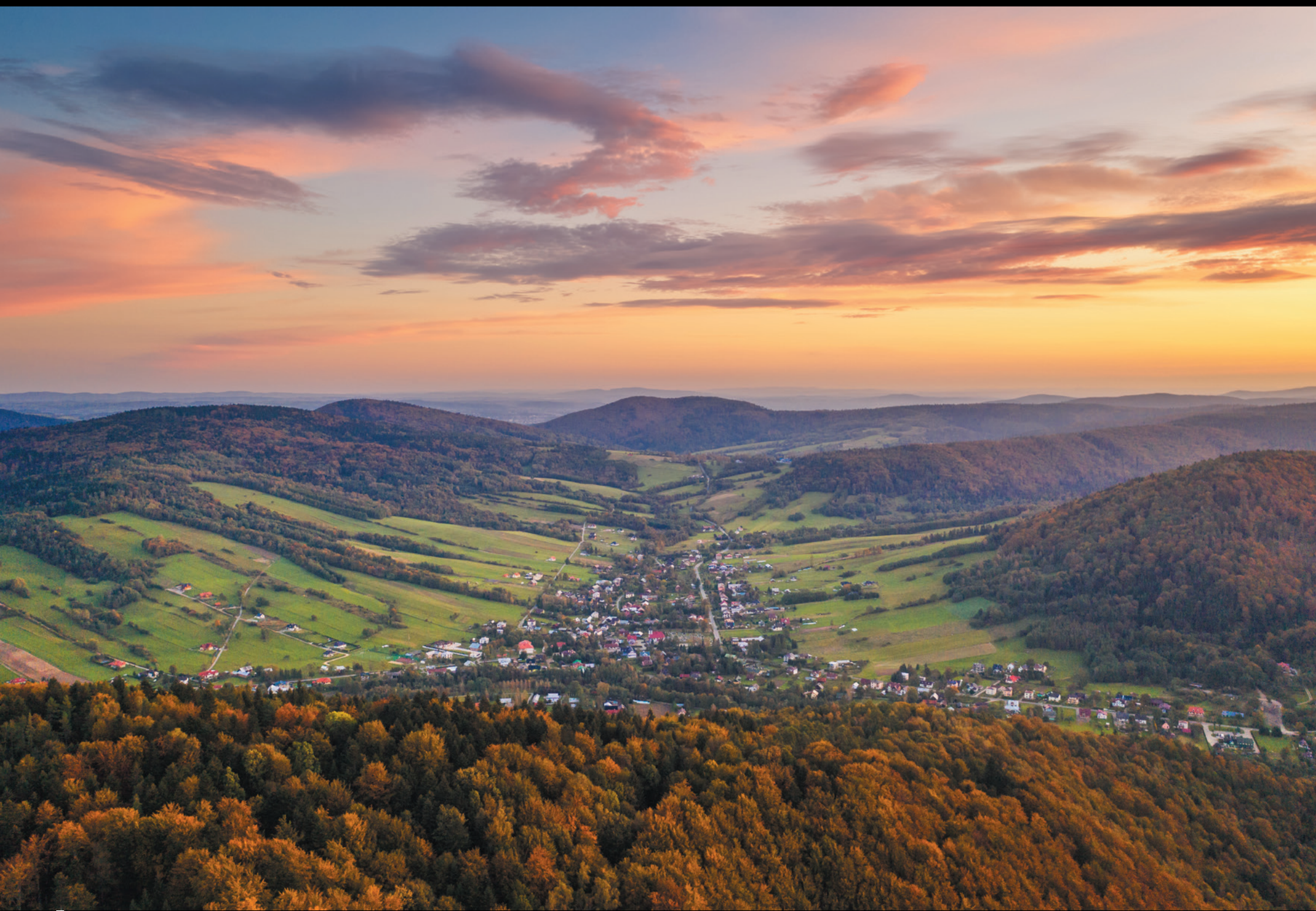
Widok na maziarską wieś Łosie Pohľad na dedinu kolomažníkov Łosie The view of the Łosie village