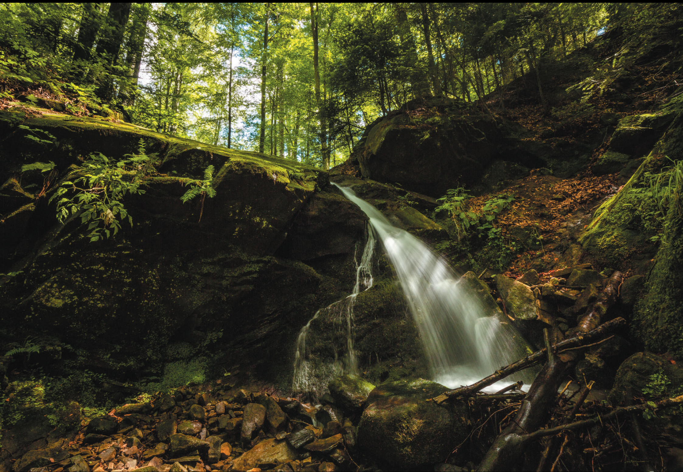
Wodospad na potoku Wołosiec Vodopád na potoku Wołosiec A waterfall on the Wołosiec stream