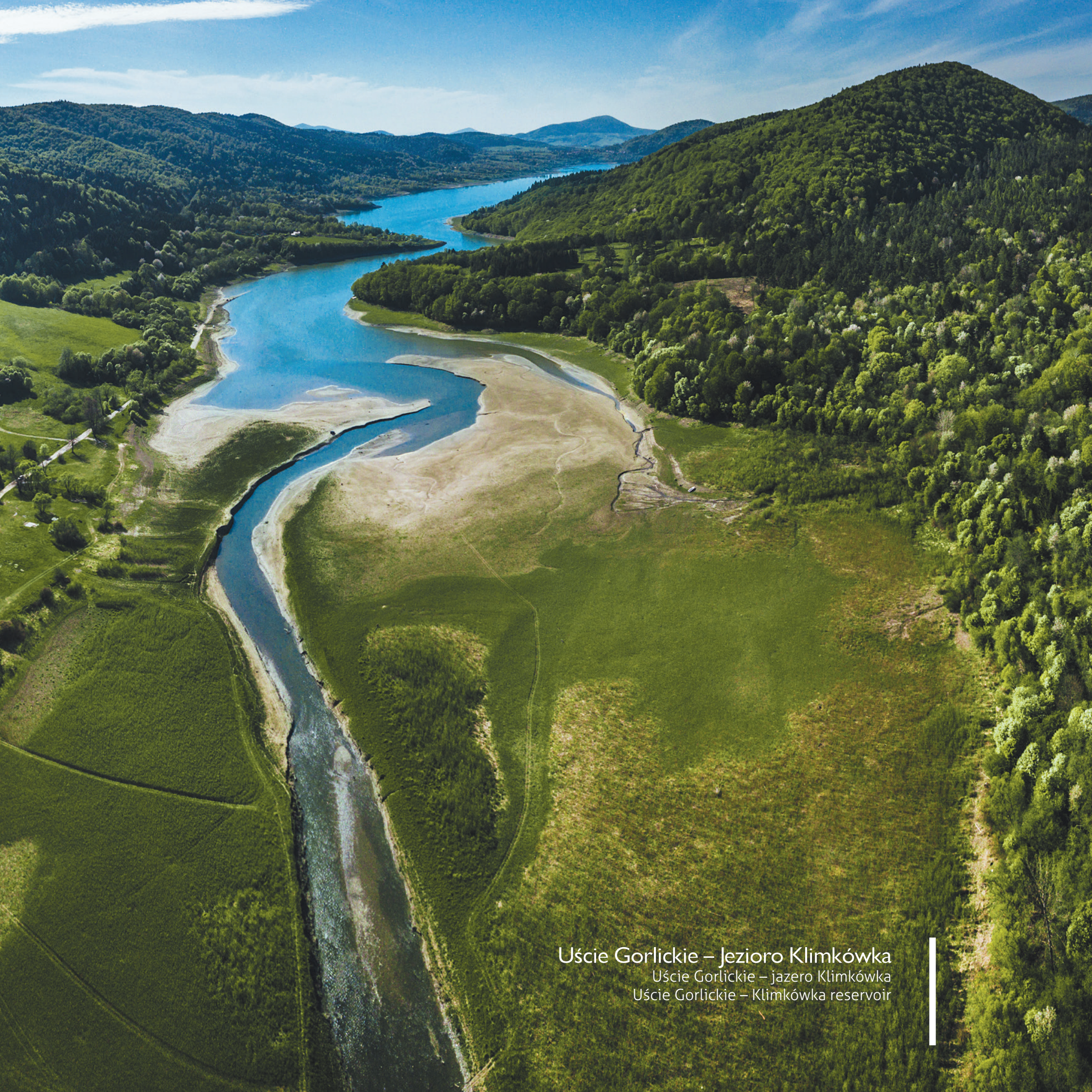
Uście Gorlickie – Jezioro Klimkówka Uście Gorlickie – jazero Klimkówka Uście Gorlickie – Klimkówka reservoir