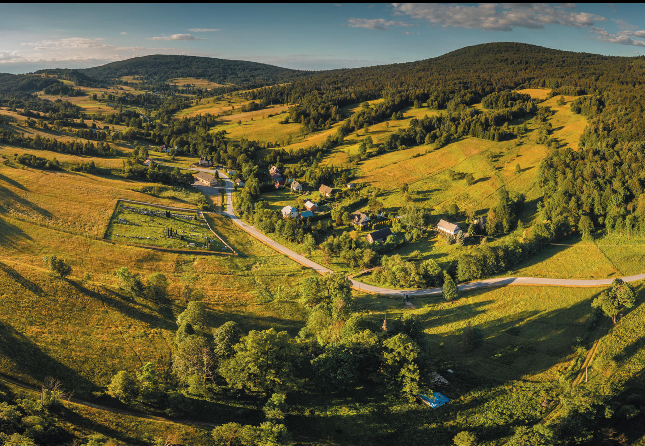
Kamieniarska wieś Bartne z lotu ptaka Dedina kamenárov Bartne z vtáčej perspektívy The aerial view of the stonemasonry village of Bartne