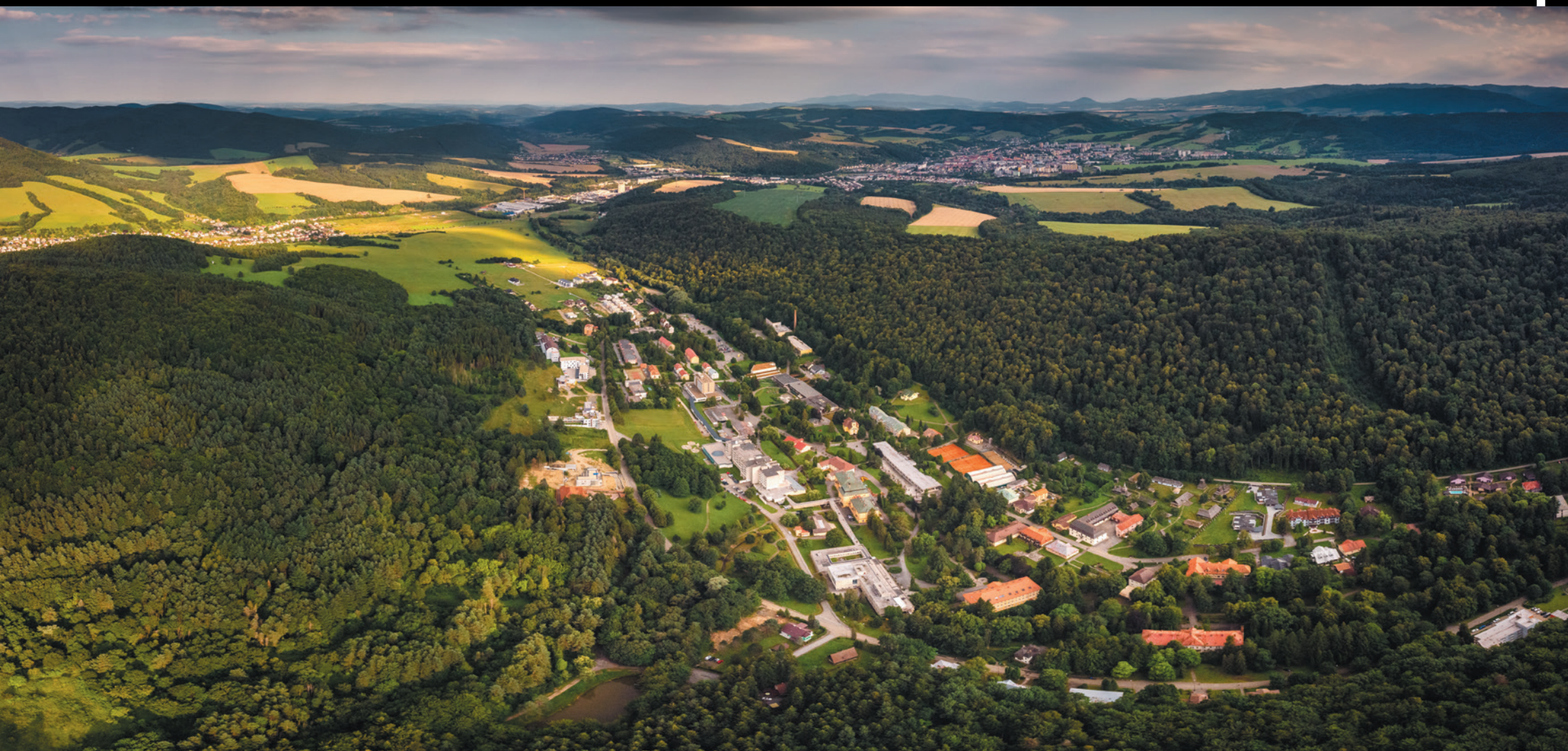
Bardejovské Kúpele – panorama z lotu ptaka Bardejovské Kúpele – panoráma z vtáčej perspektívy Panorama of Bardejovské Kúpele