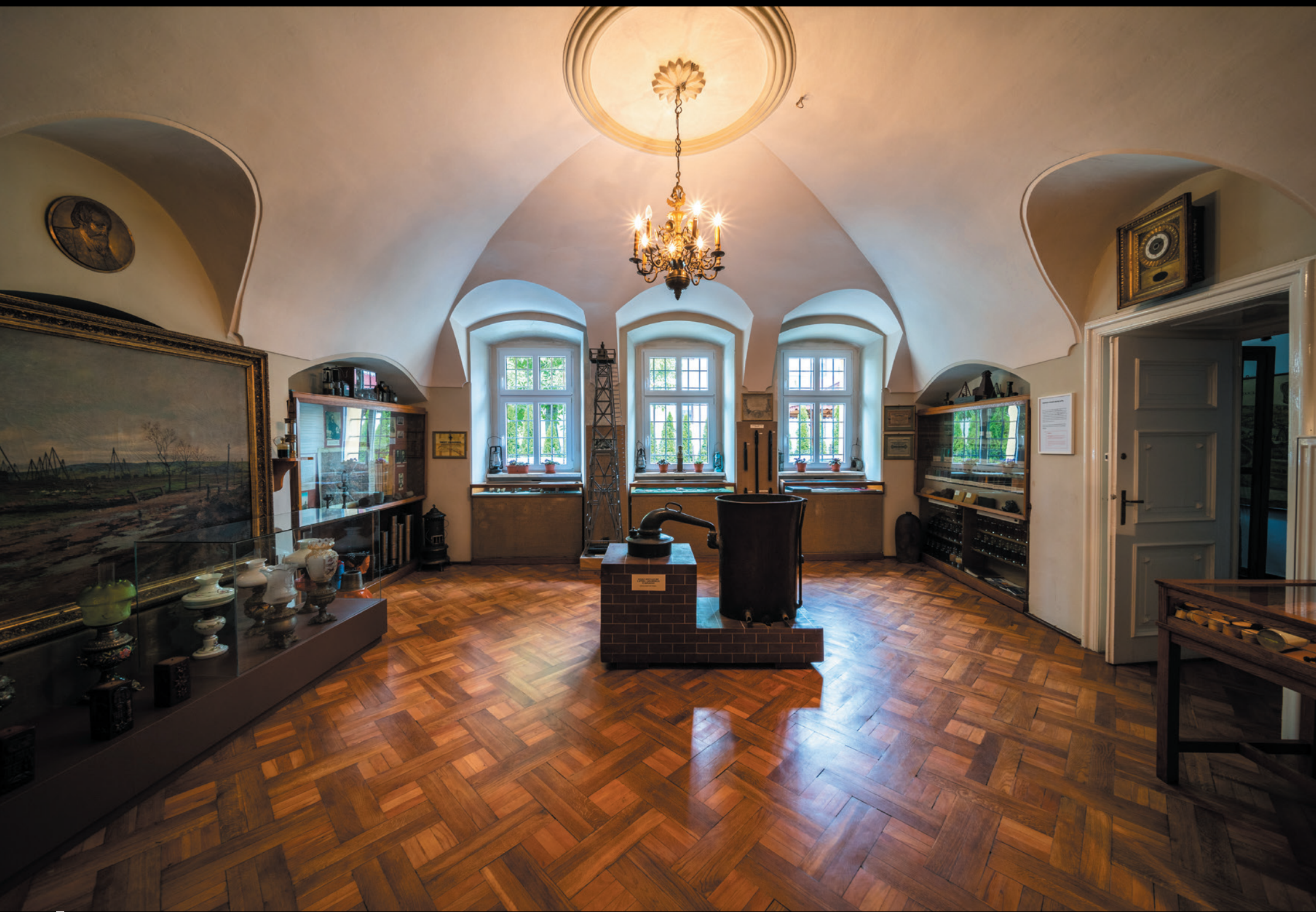
Muzeum Regionalne PTTK im. Ignacego Łukasiewicza w Gorlicach Regionálne múzeum PTTK Ignacyho Lukasiewicza v Gorliciach Regional Museum of PTTK named after Ignacy Łukasiewicz in Gorlice