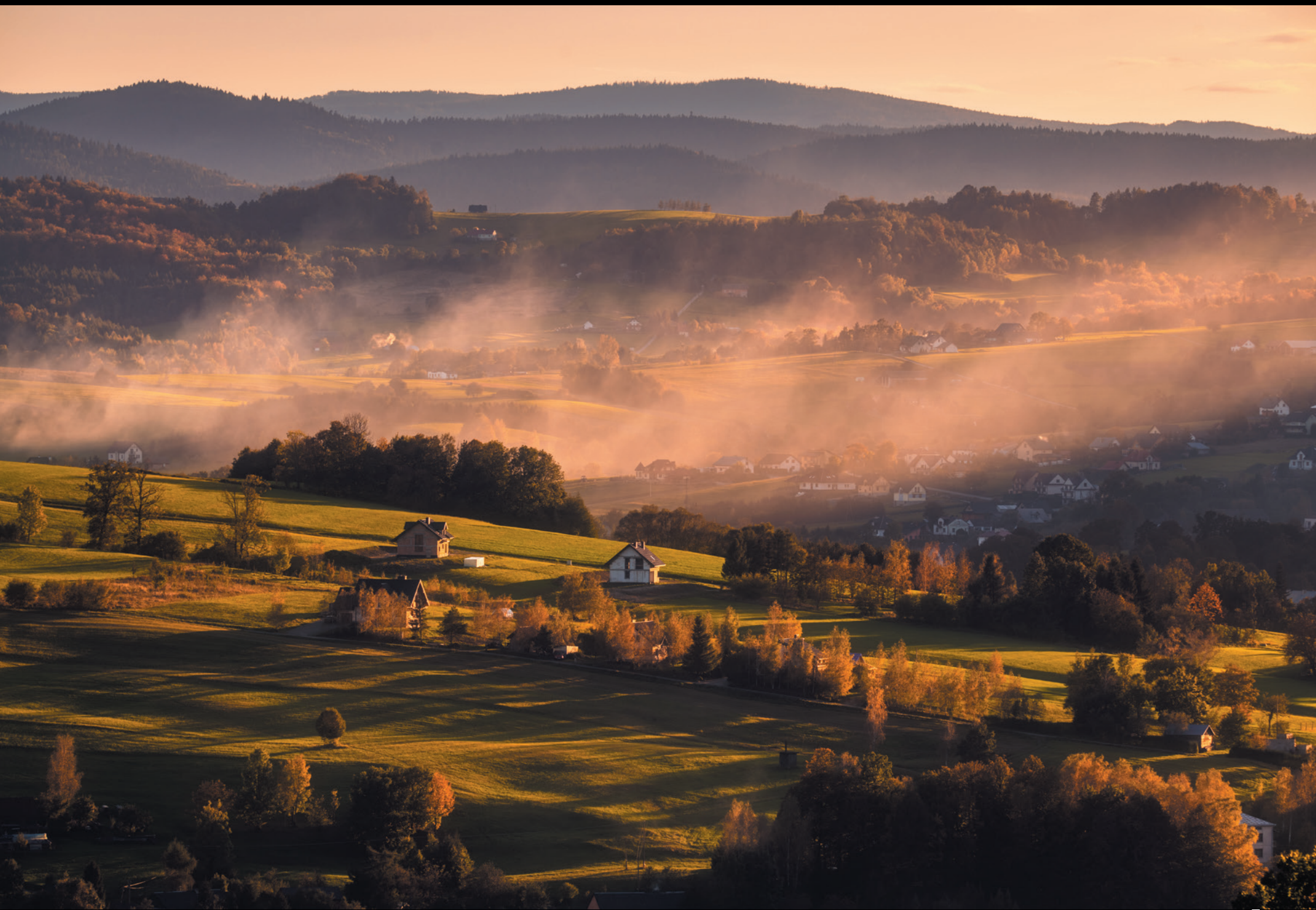
Widok ze zboczy Maślanej Góry Pohľad zo svahov Maślanej hory The view from the slopes of Maślana Góra