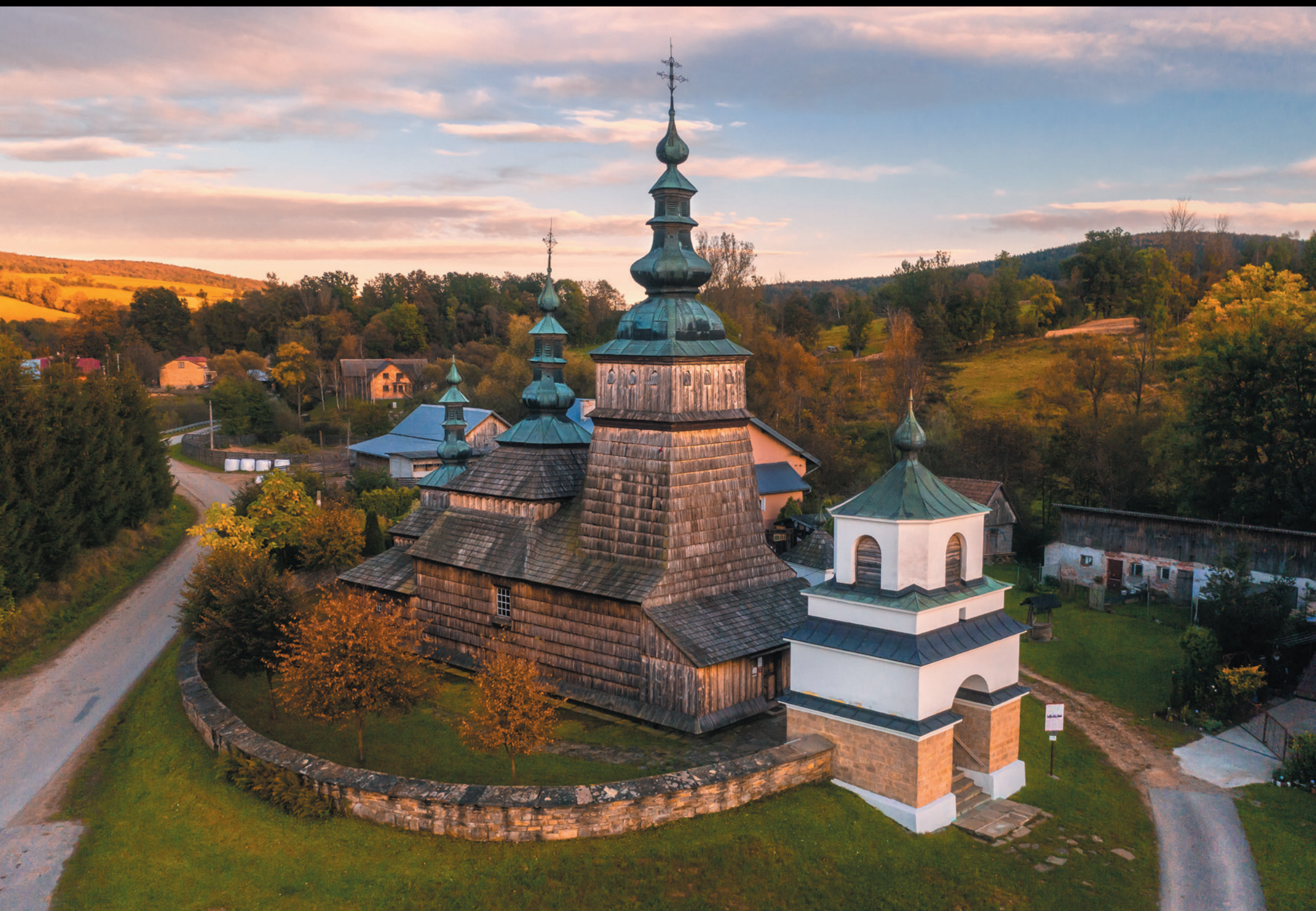
Cerkiew pw. Opieki Bogurodzicy NMP w Owczarach Chrám ochrany Presvätej Bohorodičky v Owczarách The Greek Catholic Parish Church of the Protection of the Mother of God in Owczary