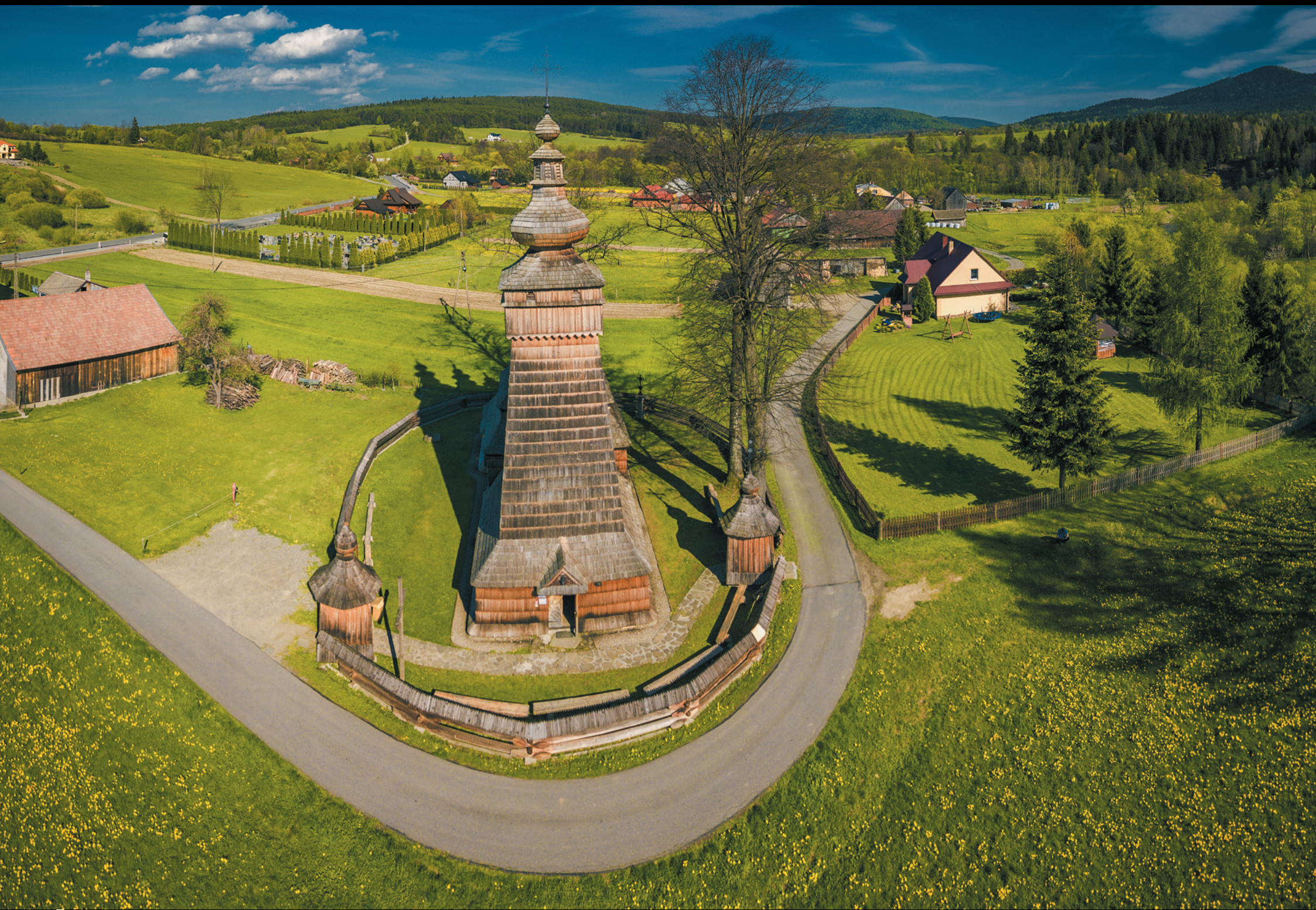
Cerkiew greckokatolicka św. Paraskewii w Kwiatoniu Gréckokatolícky chrám sv. Paraskevy v obci Kwiaton The Greek Catholic Parish Church of St. Paraskevi in Kwiaton