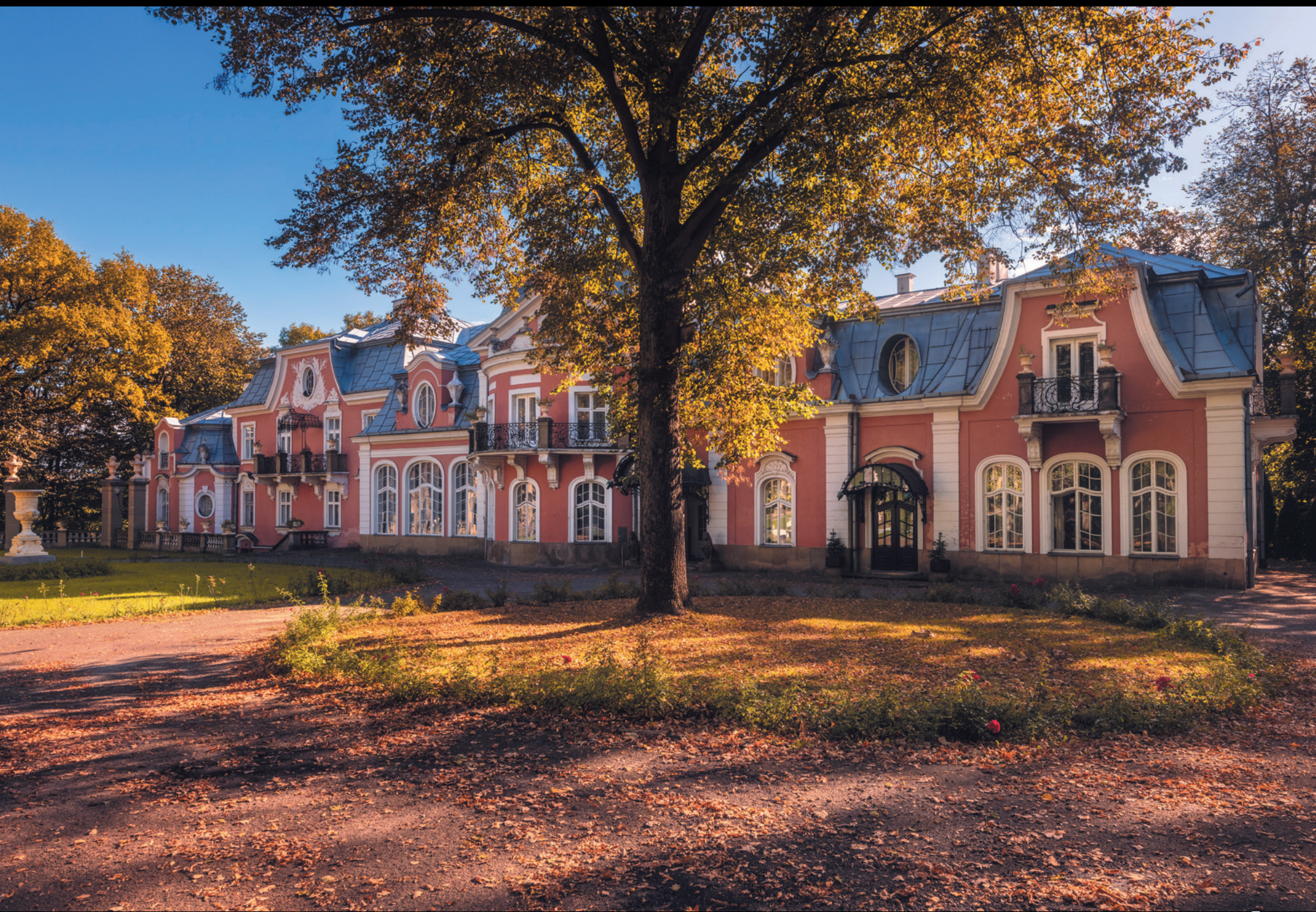
Pałac Długoszków w Gorlicach Palác Długoszovcov v Gorliciach Długosz Family Palace in Gorlice