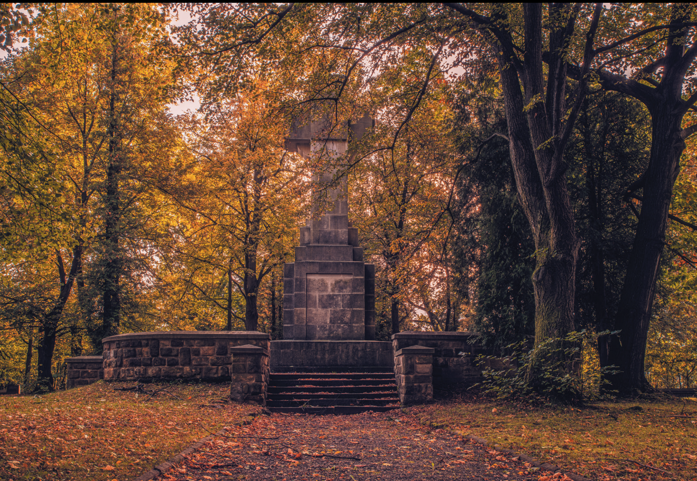
Cmentarz wojenny nr 91 w Gorlicach Vojenský cintorín č. 91 v Gorliciach World War I Cemetery No. 91 in Gorlice