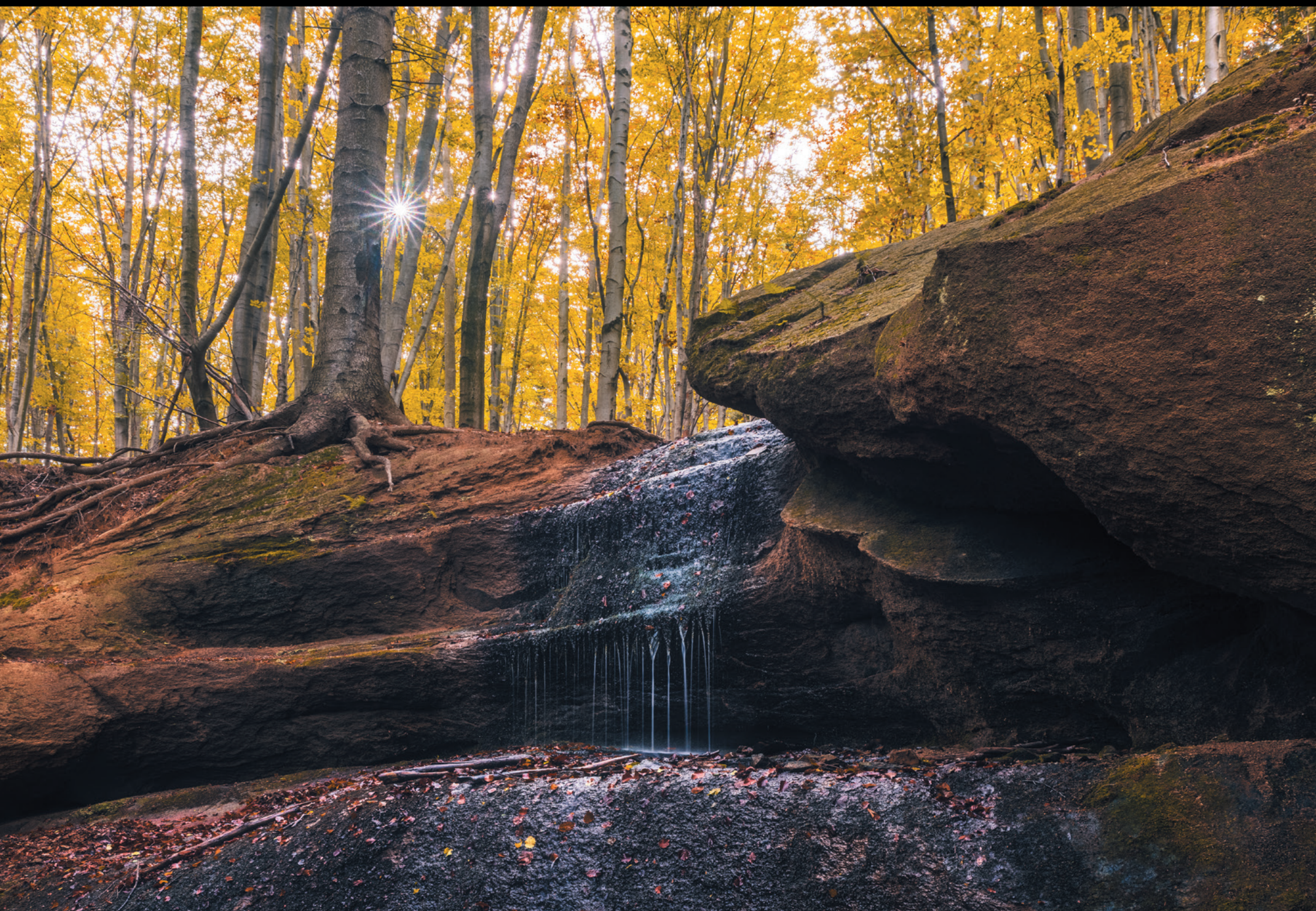
Wodospad Magurski Vodopád Magurski Magura Waterfall