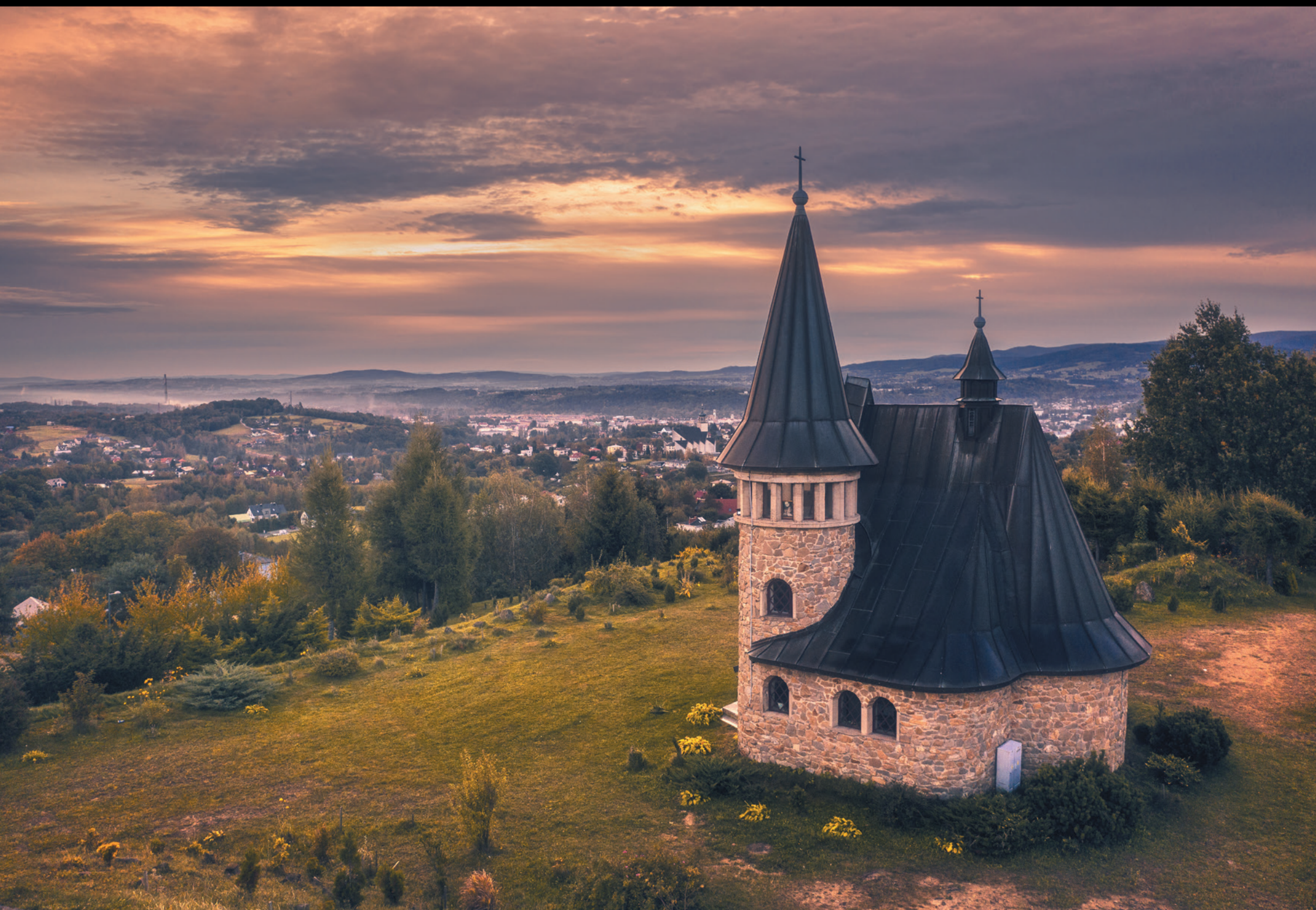
Gorlicka Golgota Gorlická kalvária Gorlice Golgotha