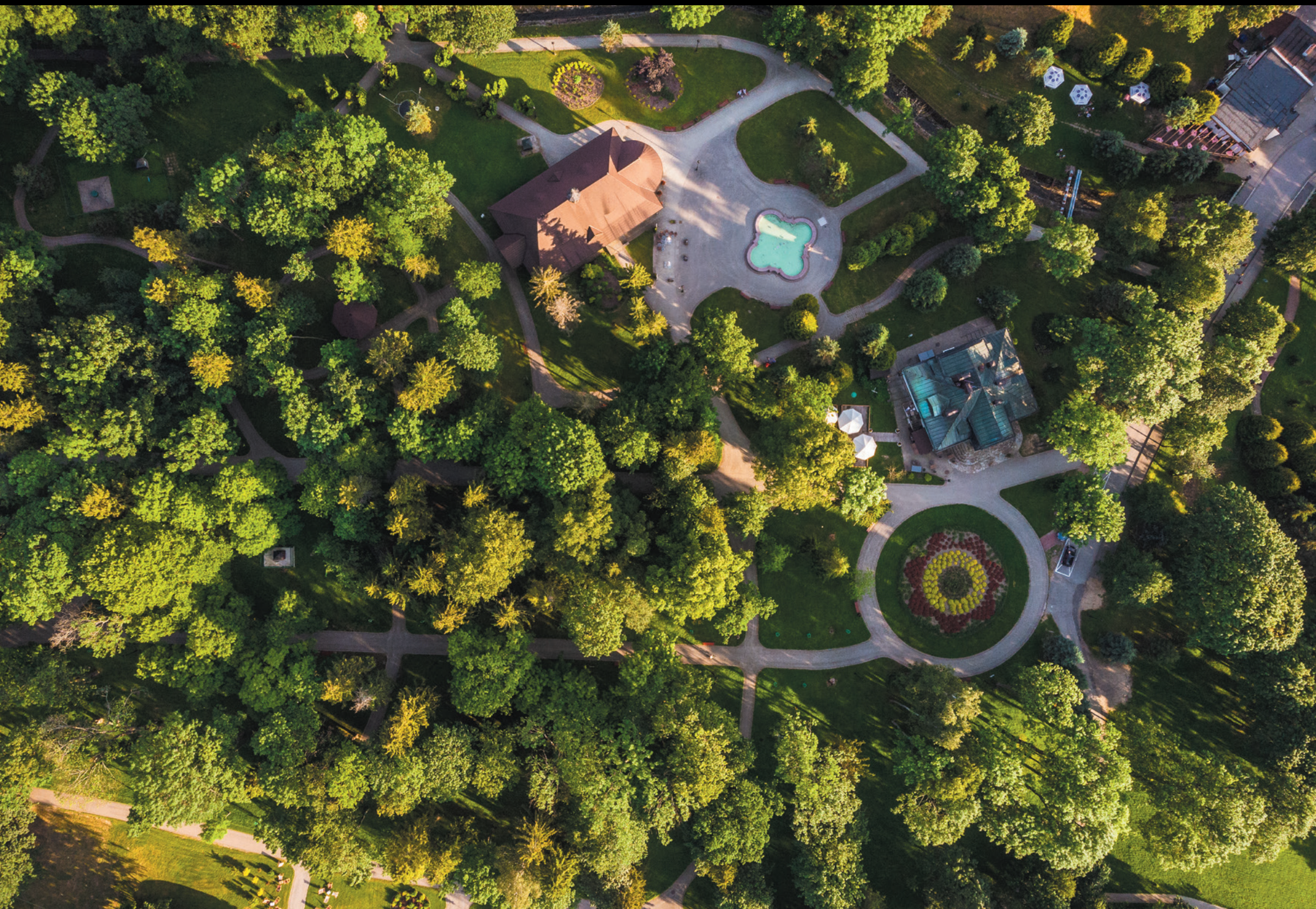
Park zdrojowy w Wysowej z lotu ptaka Kúpeľný park vo Wysovej z vtáčej perspektívy The spa park in Wysowa from the bird's eye view