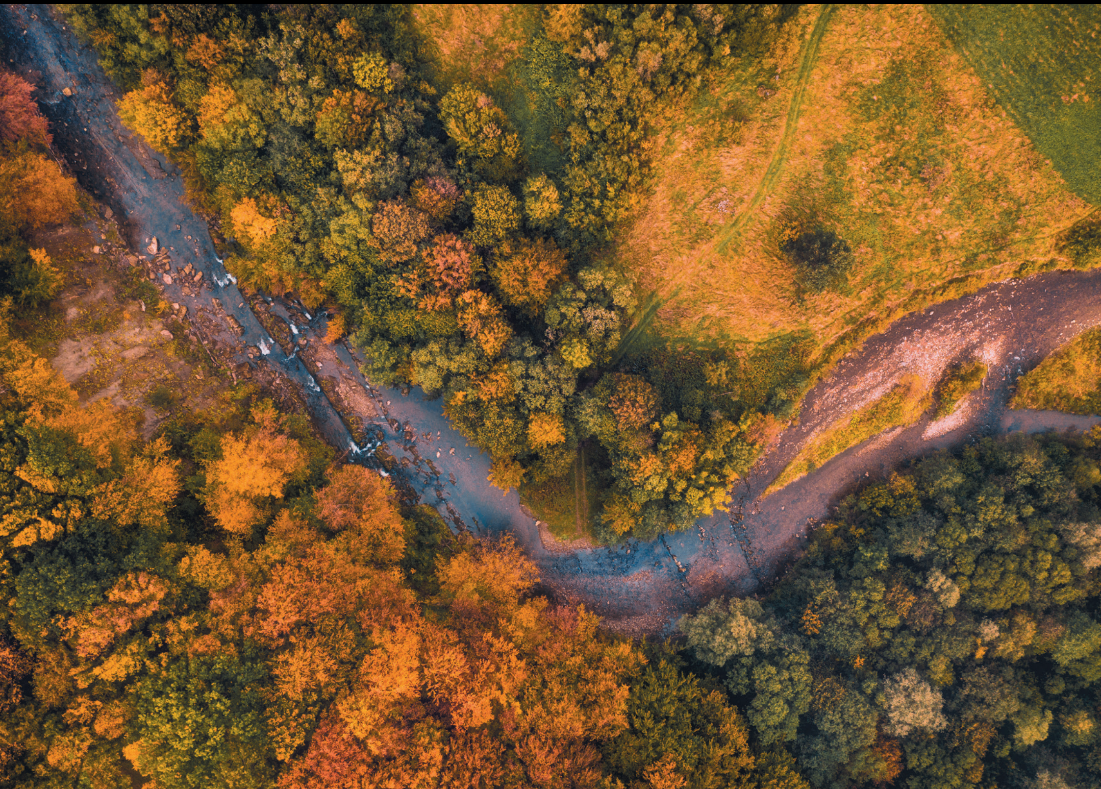
Zakole rzeki Sękówki z lotu ptaka Zákruta rieky Sękówka z vtáčej perspektívy The bird's eye view of the Sękówka River bend