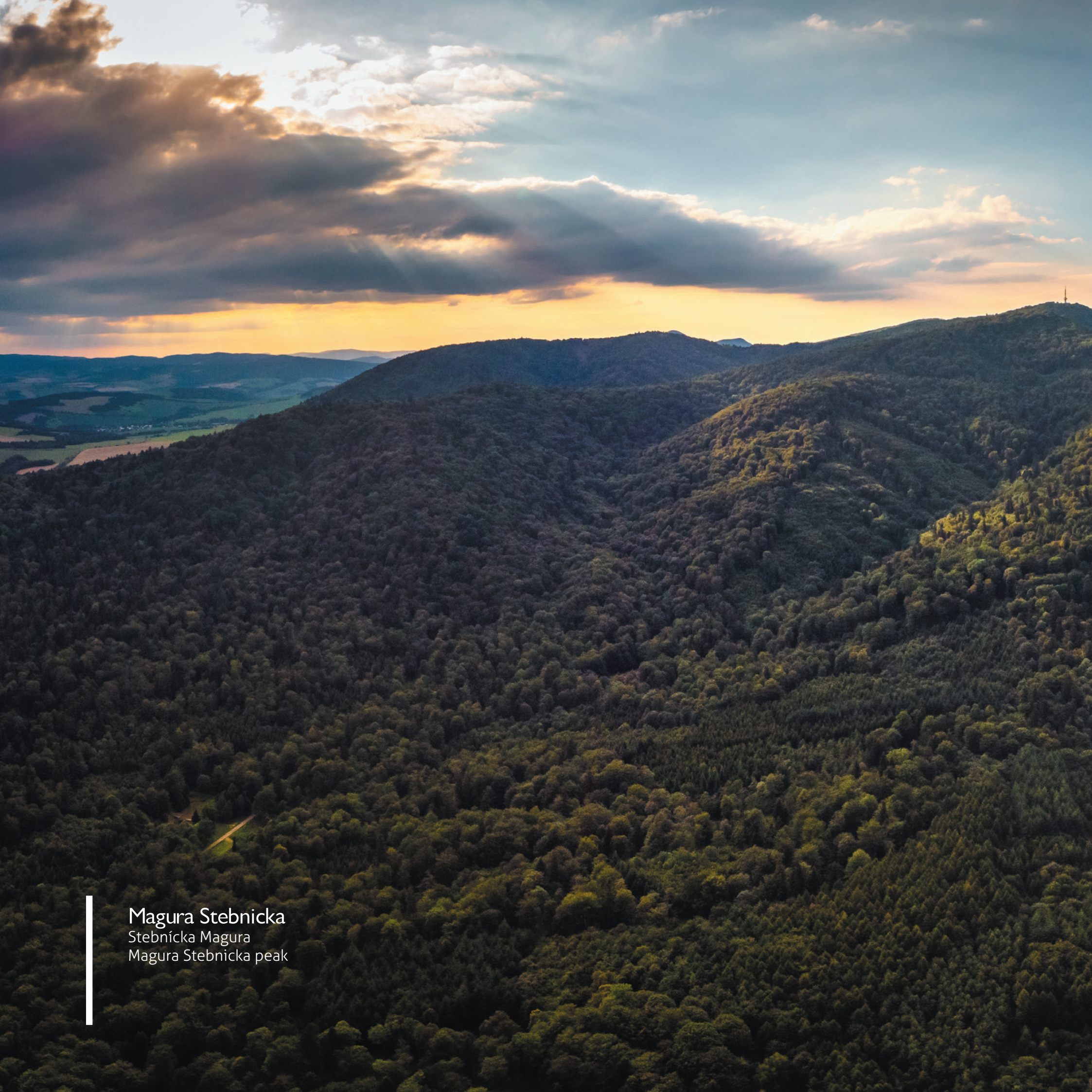
Magura Stebnicka Stebnícka Magura Magura Stebnicka peak