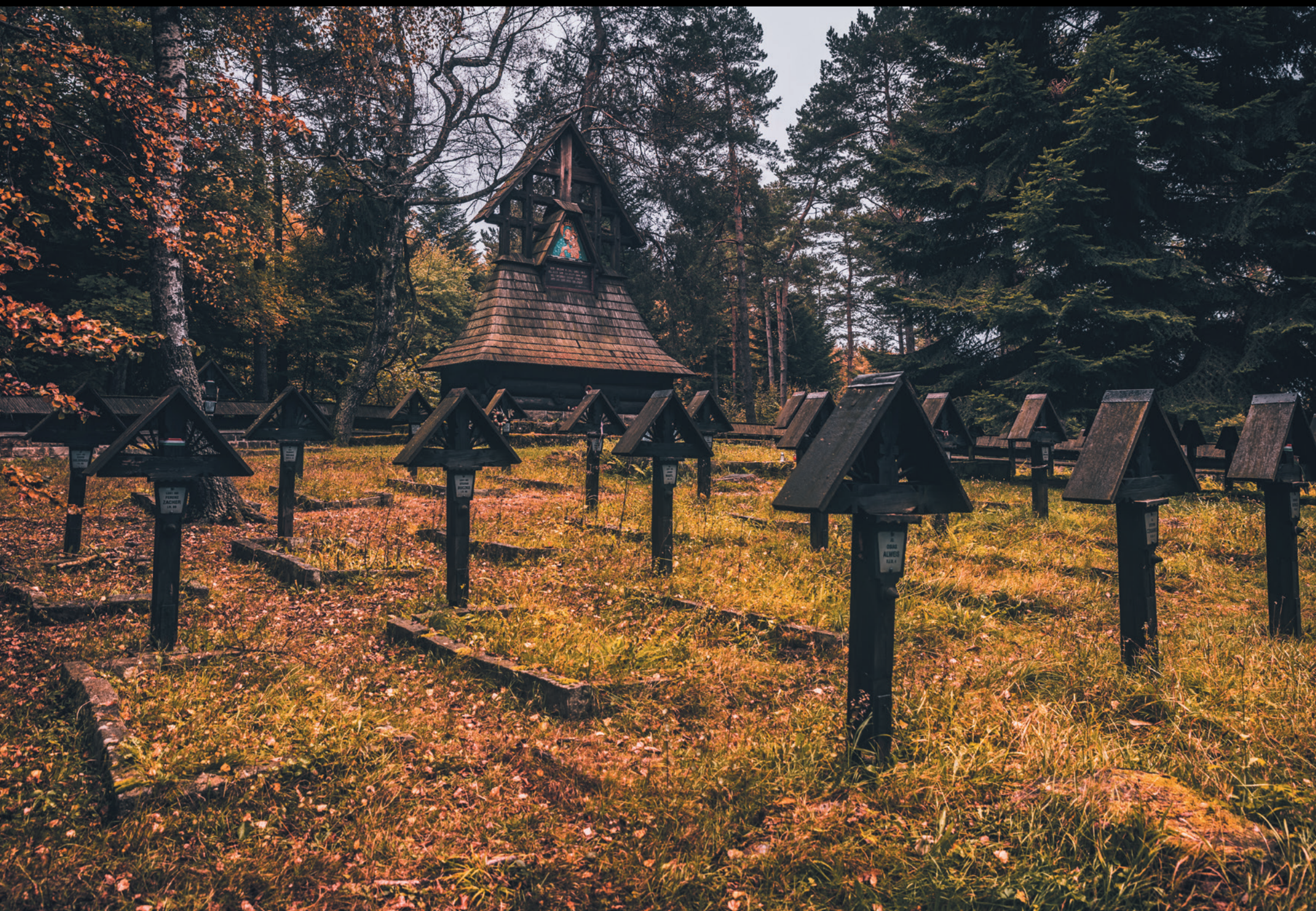
Cmentarz wojenny nr 60 na Przełęczy Małastowskiej Vojenský cintorín č. 60 v horskom sedle Przełęcz Małastowska World War I Cemetery No. 60 on the Małastowska Pass