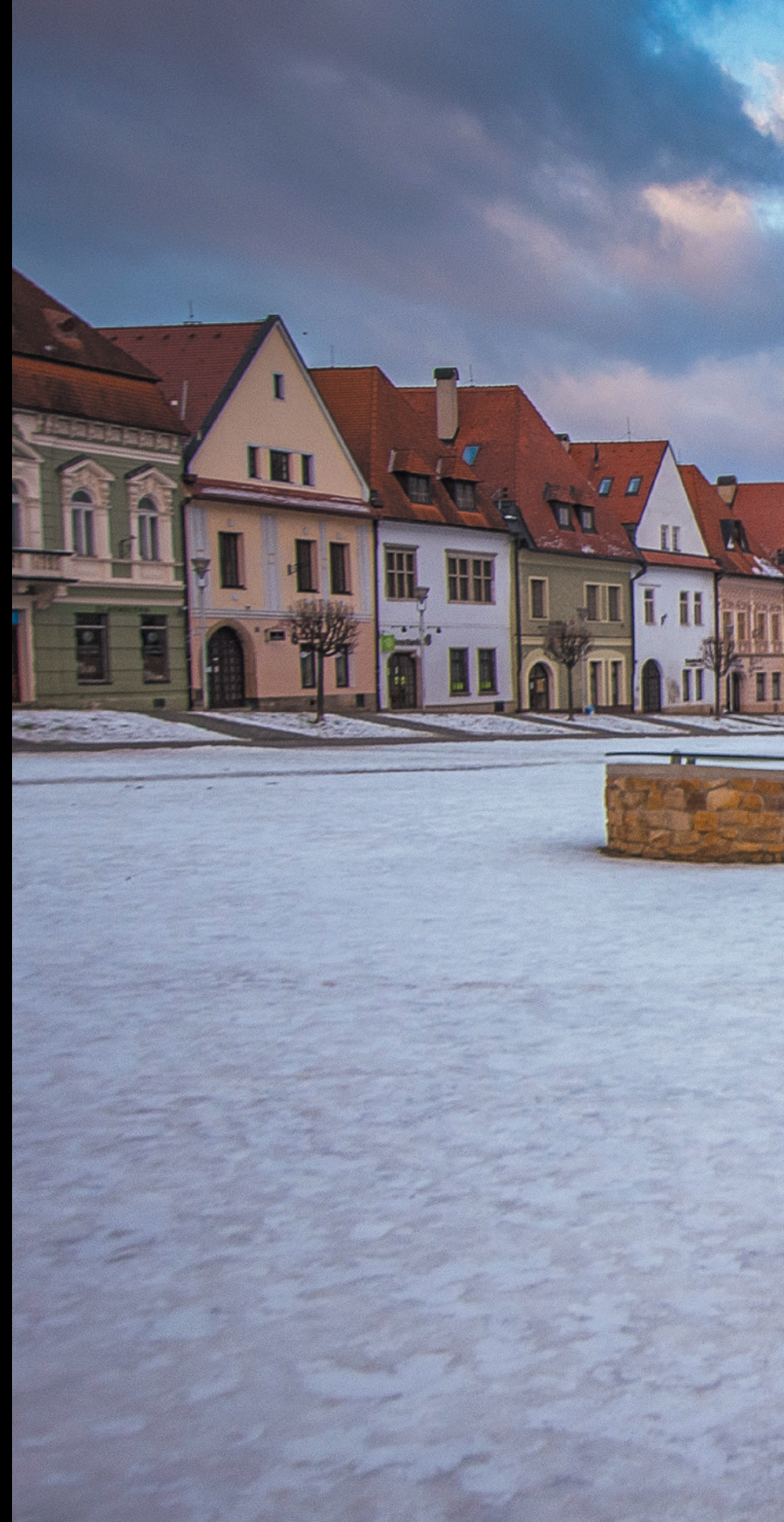
Rynek w Bardejowie Radničné námestie v Bardejove The market square in Bardejov