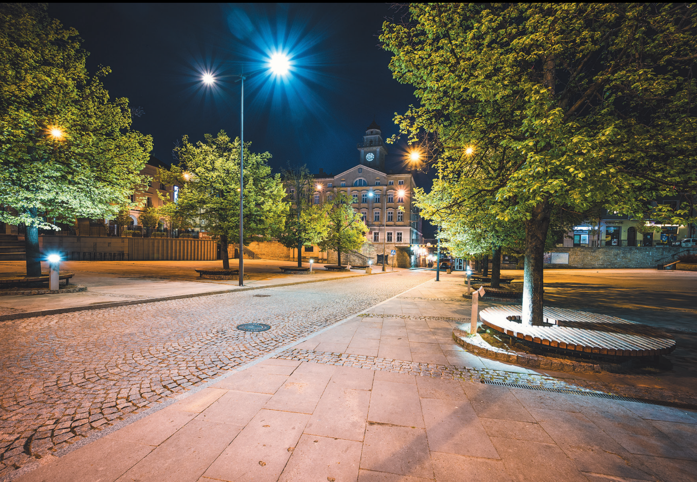
Rynek oraz Ratusz w Gorlicach Hlavné námestie a radnica v Gorliciach Market Square and Town Hall in Gorlice