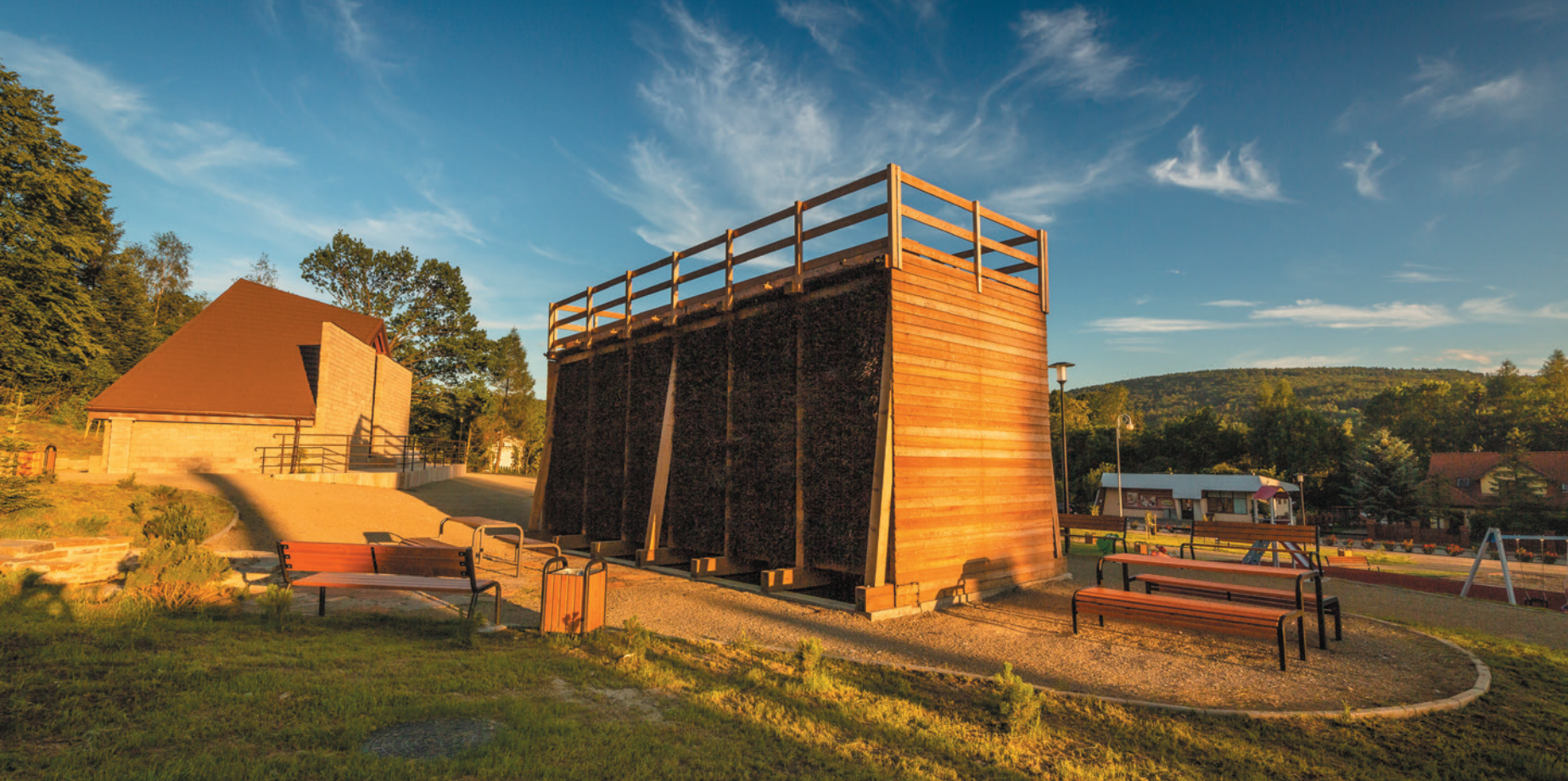
Uzdrowisko Wapienne – težnia solankowa Kúpeľná obec Wapienne – solanková grádovňa Wapienne spa – graduation tower